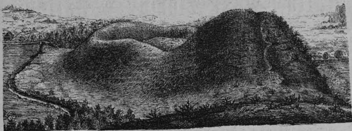
OKOPY POD WSIAMI WNORY I GRODZKIE (Łomżyńskie).