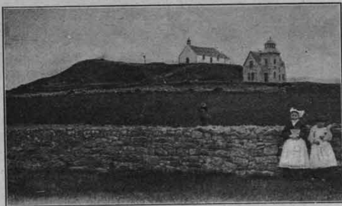
TUMULUS ST. MICHEL.