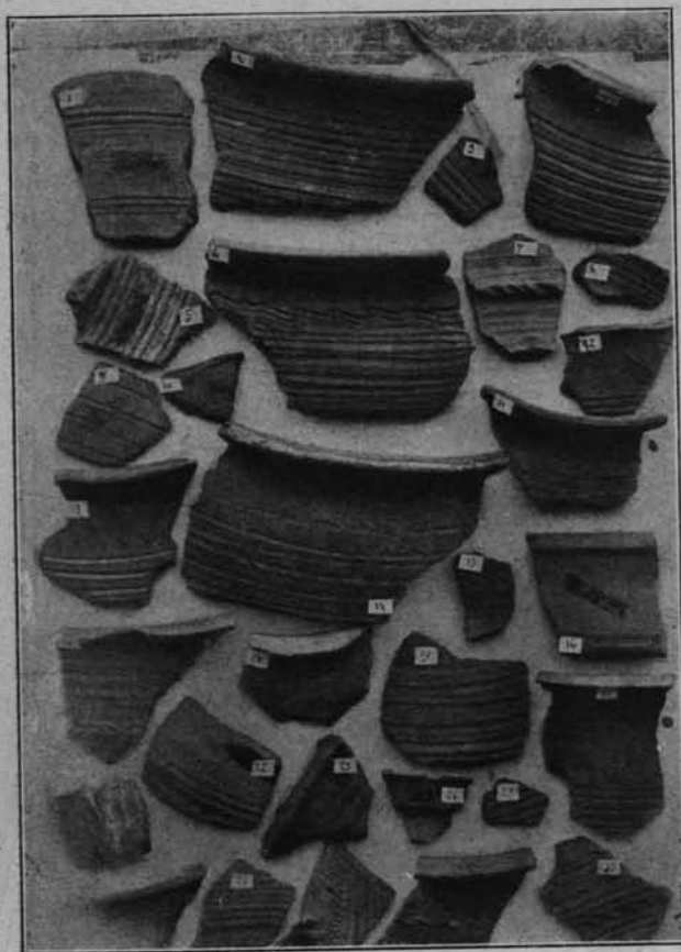
SZCZĄTKI GARNKÓW Z GRODZISKA W WIZNIE NAD NARWIĄ.

Na rolniczem Mazowszu dla osłony od napadów dziczy jaćwiezkiej pobudowali Mazowszanie liczne grody, a mianowicie: w Wi-