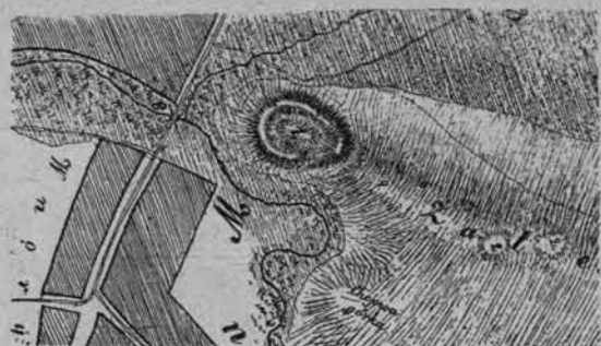
PLAN GRODZISKA POD WSIAMI GRODZKIE I WNORY.