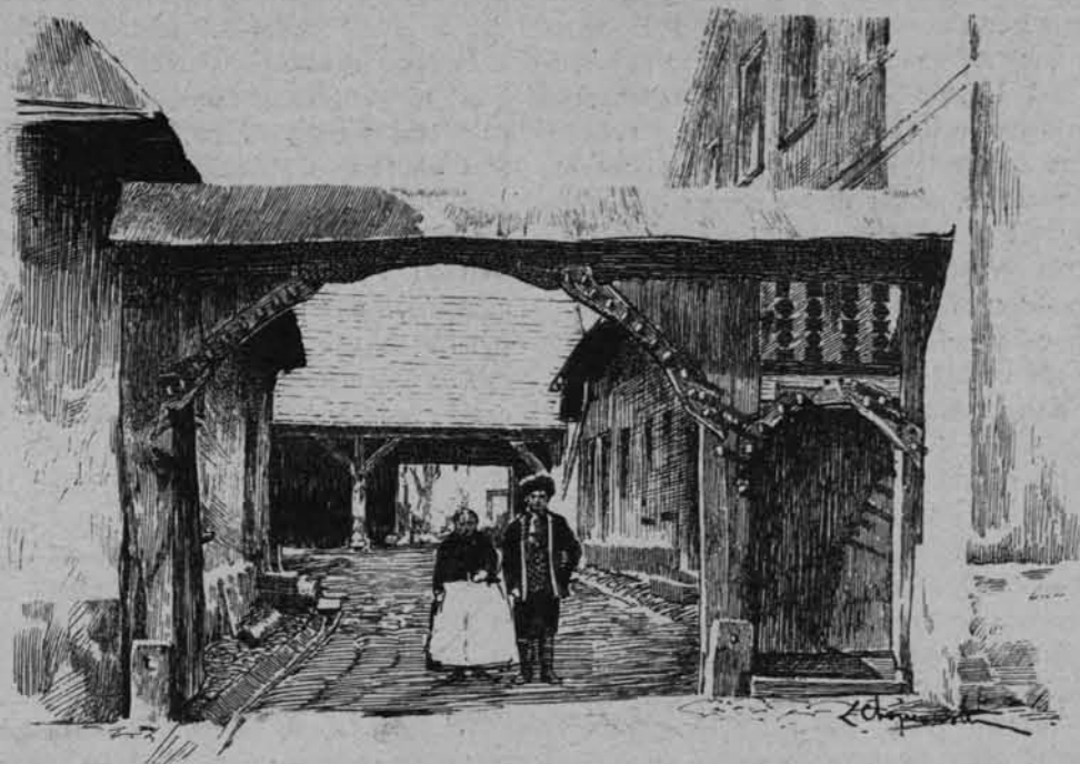
BRAMA W BYTOMIU PRZY ULICY PIEKARSKIEJ.

Rys. L. Chojnowski, ze zbiorów Z. Glogera.