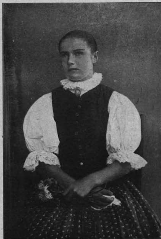
fol. E. Stercula.

Górale orawscy są zdolni i bystrego umysłu. Na Orawie zajmuje się rzemiosłami kilku wszechstronnych rzemieślników, zwanych „natu-