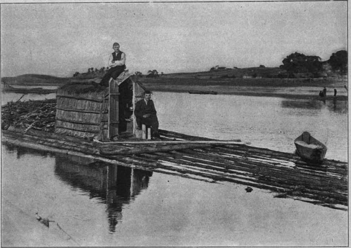
TRATWY NA NARWI.