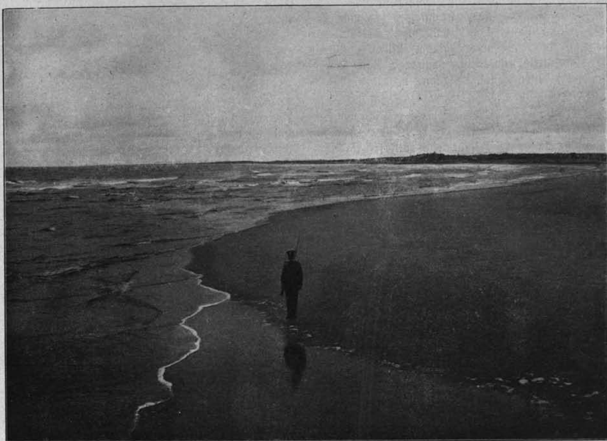
fol. J. Niekrasz.