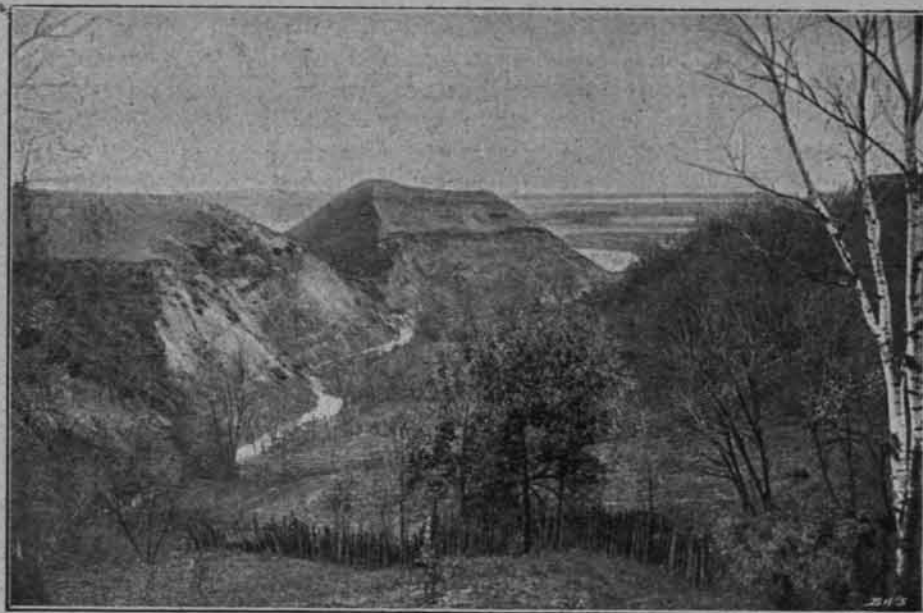
GÓRA ZAMKOWA W MERECZU.