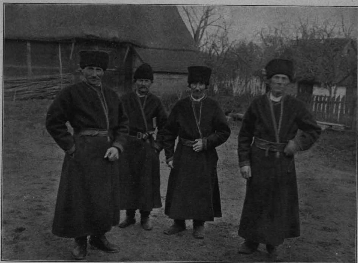
GOSPODARZE Z WŁOSTOWIC (POW. PUŁAWSKI).