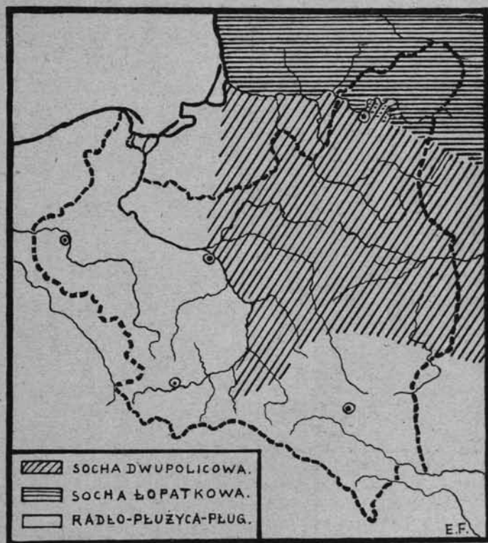
Ryc. 261. Zasięg sochy dwupolicowej i łopatkowej w Polsce.

Socha dwupolicowa występuje głównie na obszarze zamieszkania mazurów, a jej zasięg