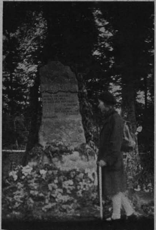
Ryc. 284. Kamień pamiątkowy ku czci Stefana Żeromskiego w Puszczy Jodłowej.

Słowo wstępne wypowiedziała prezeska Kółka