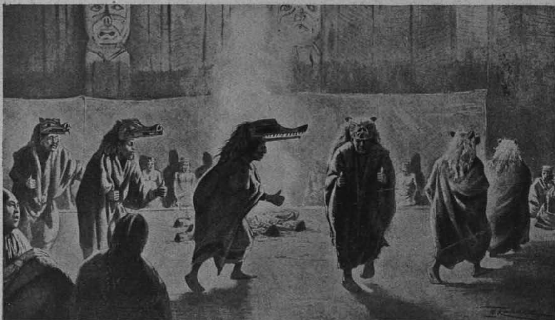
Ryc. 279. Z dzieła: Fr. B o a s. The social organization and the secret societies of the Kwakiutl Indians. —Tablica 36. Walas'axa—obrzędowy taniec wilczy tajnego klubu religijnego u Indjan Kwakiutłów nad Oceanem Spokojnym.

a więc jest zwiastunem atmosferycznym—wycie oznacza zmianę pogody, gdy przebiega przez drogę, stanowi dobrą wróżbę, bywa dobrym wychowawcą—dość przytoczyć rzymską legendę o wilczycy, karmiącej Romulusa i Remusa i nieco podobną białoruską opowieść o dziecku, porwanem przez wilczycę i w spokoju bawiącym się z małymi wilczętami.