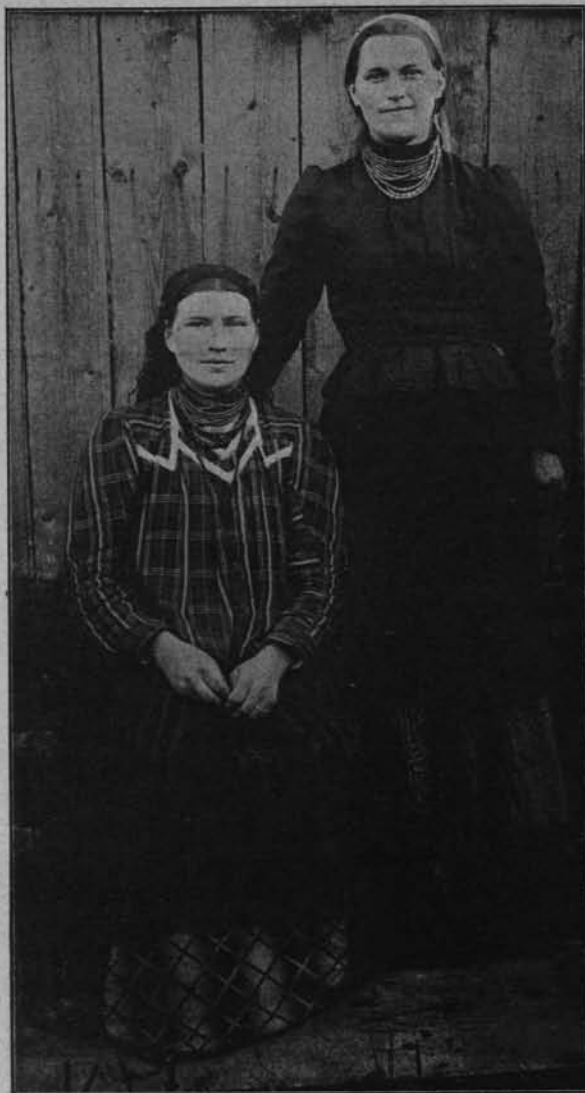
TYPY KOBIECE ZE ŚWIĘTEJ KATARZYNY, POW. KIELECKI. fot. F. Greim.

Pojedziewa do ludzi, Uczyć ich rozumu, Jak ich naucywa — Wróciwa do domu 1) .