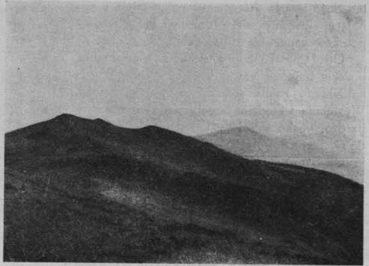
Ryc. 157. WIDOK Z HALICZA NA GRZBIETY WSCHODNIE.

my dalej. Przez piękne łąki i pola dostajemy się do długiej wsi dolinnej—Bukowca, rozłożonej w ten sposób po brzegach potoku, że domy przerzucają się grupami z jednego brzegu na drugi. Domy bez wyjątku z drzewa, kryte gontem, rzadziej słomą, niebielone, a jednoczące pod wspólnym dachem izby mieszkalne i przybytki dla dobytku. Kominów nie zauważyliśmy. Pięknie odbijała na tle tych domów różowo-czerwona cerkiewka z kilku ponakładanymi na sobie dachami. Wieś położona od 750—800 m. np. wchodzi w las. Bystry potok Bukowiec, pełen małych wodospadów i bystrzyc, prowadzi nas, po krętej