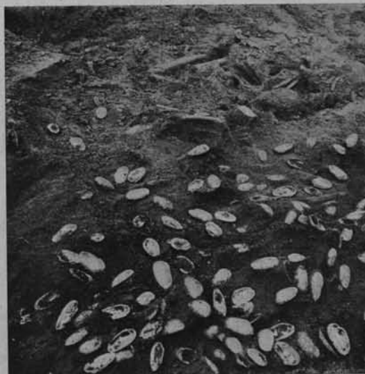
Ryc. 105. RESZTKI STYPY POGRZEBOWEJ NA GROBIE.

Zanim naukowe publikacje zostaną ogłoszo-