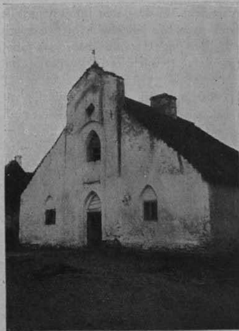
Ryc. 104. KAPLICA ARJAŃSKA W GNOJNIE.

Z pośpiechem dążyliśmy do Gnojna.—Stare gniazdo szlacheckie. Było i w rękach możnowładców. Obecnie w posiadaniu p. G. Łu-