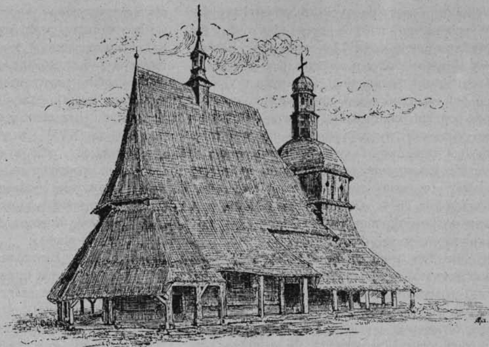
Rys. Stanisław Wyspiański.