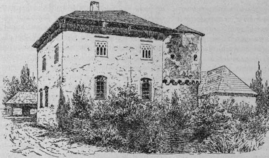
Rys. Stanisław Wyspiański.