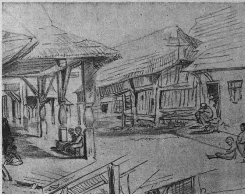
Rys. Stanisław Wyspiański.