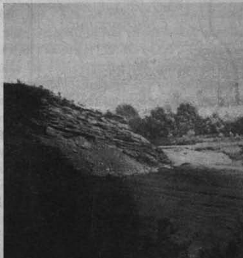
Ryc. 39. Widok na część doliny przełomowej Soły.

Co się tyczy budowy geologicznej, to Beskid Mały składa się przeważnie z warstw piaskowca godulskiego i ciężkowickiego, ku północy zaczynają przeważać ciemne łupki cieszyńskie. Naogół jest to materiał dość odporny, co powoduje wyzyskanie go przez człowieka (liczne kamieniołomy). Nie ma jednak takiej odporności, aby tworzyć śmigłe formy tatrzańskie, brak mu również różnic twardości poszczególnych kompleksów warstw, jak to mamy w Pieninach, gdzie z miękkiego podłoża fliszowego wysterczają ostre formy skałek z twardszych wapieni. Przełom Soły nie posiada takich cech, Beskid Mały składa się z lekko zaokrąglonych pasm, właściwych Kar-