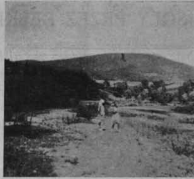
Ryc. 33. Dolina Soły przed przełomem, w dali Beskid Mały.

Małego. Kotlina Żywiecka o trójkątnym kształcie ciągnie się w kierunku wyraźnego obniżenia między Beskidem Zachodnim a Małym — bramy Wilkowskiej 419 m. W tym też kierunku otwiera się naturalna droga dla Soły w stronę doliny Białej. Nasuwa się tu odrazu przypuszczenie o przepływie dawnej Soły przez przełęcz Wilkowską, zagad-zjawiskiem tektonicznym. Niewątpliwie pewien wpływ wywarł tu też lodowiec północny, który dosięgnął bramy Wilkowskiej.