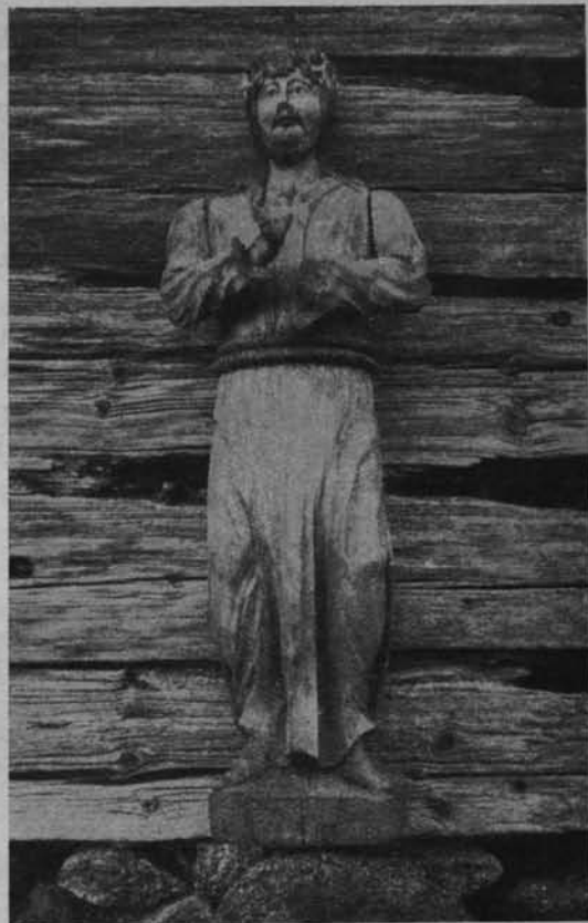
Ryc. 45. Figura Chrystusa w Krewie.

Kapliczka została zbudowana przeszło 200 lat temu z następującego, jak głosi miejscowa, z ust do ust podawana, tradycja, wydarzenia.