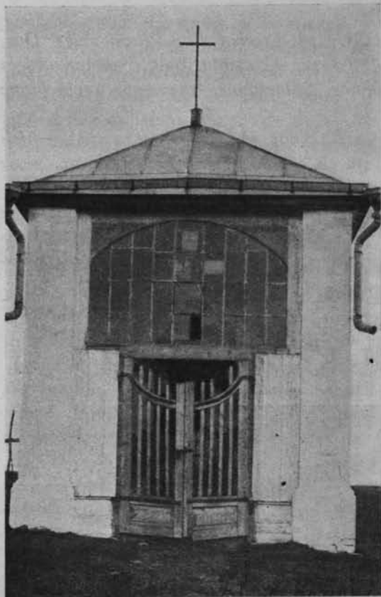
Ryc. 44. Kaplica nad jez. Berezwezc.

lazny o 1,5 m. wys. Do kapliczki prowadzą drzwi drewniane sztachetowe 2,3 m. wys. i 2,9 m. szer. nad którymi znajduje się żelazna rama okienna o szybach wielkości 40×30 cm.