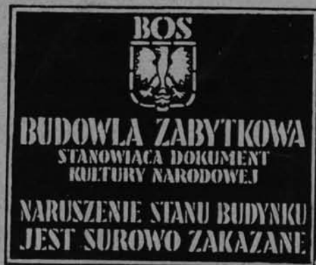
Ryc. 34. „Czerwona tablica” Biura Odbudowy Stolicy.

Tablice te sygnalizując, że obiekt — na którym się one znajdują — jest zabytkowym, podają nadto w kilku wierszach jego „Życiorys”, historię, zwięzłe dzieje, wyszczególniając obok dat najważniejsze wydarzenia z nimi związane. Tak więc tablica ma być kartą pogłądowej historii, dającej najogólniejsze — ale przy tym najważniejsze wiadomości o zabytku — wiadomości, które winny być wstępem do dalszych uzupełnień i prac samokształce-