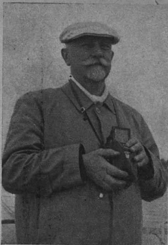
Ryc. 25. Prof. Jan Bulhak w lipcu 1947 na statku na jez. Niegocin, k. Góryoka.

mistrz fotografiki pomagał jej w wywoływaniu zdjęć przez nią robionych.