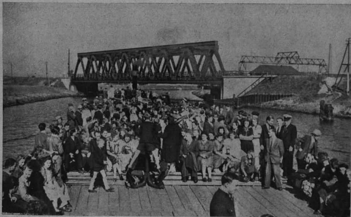
Ryc. 22 Jedna z masowych wycieczek barkami zorganizowanych dla świata pracy przez Związki Zawodowe i Oddział PTK w Katowicach.