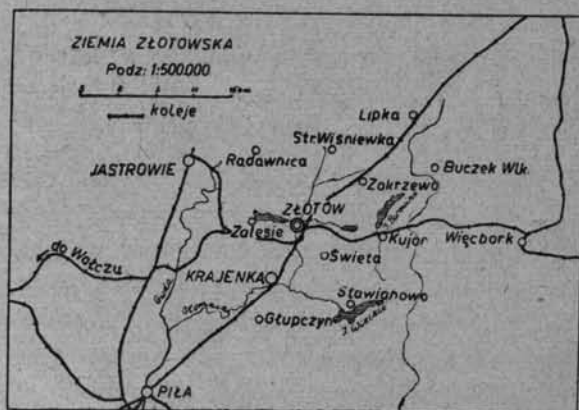
Ryc. 26. Mapa Ziemi Złotowskiej.

Do pierwszego rozbioru Polski tj. do roku 1772 Ziemia Złotowska położona na półn. zachodnim krańcu Wielkopolski należała terytorialnie do województwa kaliskiego, a nie do poznańskiego. Tylko pod względem kościelnym należała do archidiecezji gnieźnieńskiej. Ta ciekawa przynależność administracyjna do odległego Kalisza datuje się od roku 1253, kiedy to książęta wielkopolscy Przemysław I i Bolesław, synowie Odonica, podzielili się Wielkopolską w ten sposób, że Bolesław otrzymał wschodnią część z Gnieznem i Kaliszem a Przemysław zachodnią część z Poznaniem. W późniejszych czasach ten podział Wielkopolski pozostał nienaruszony. Ziemia