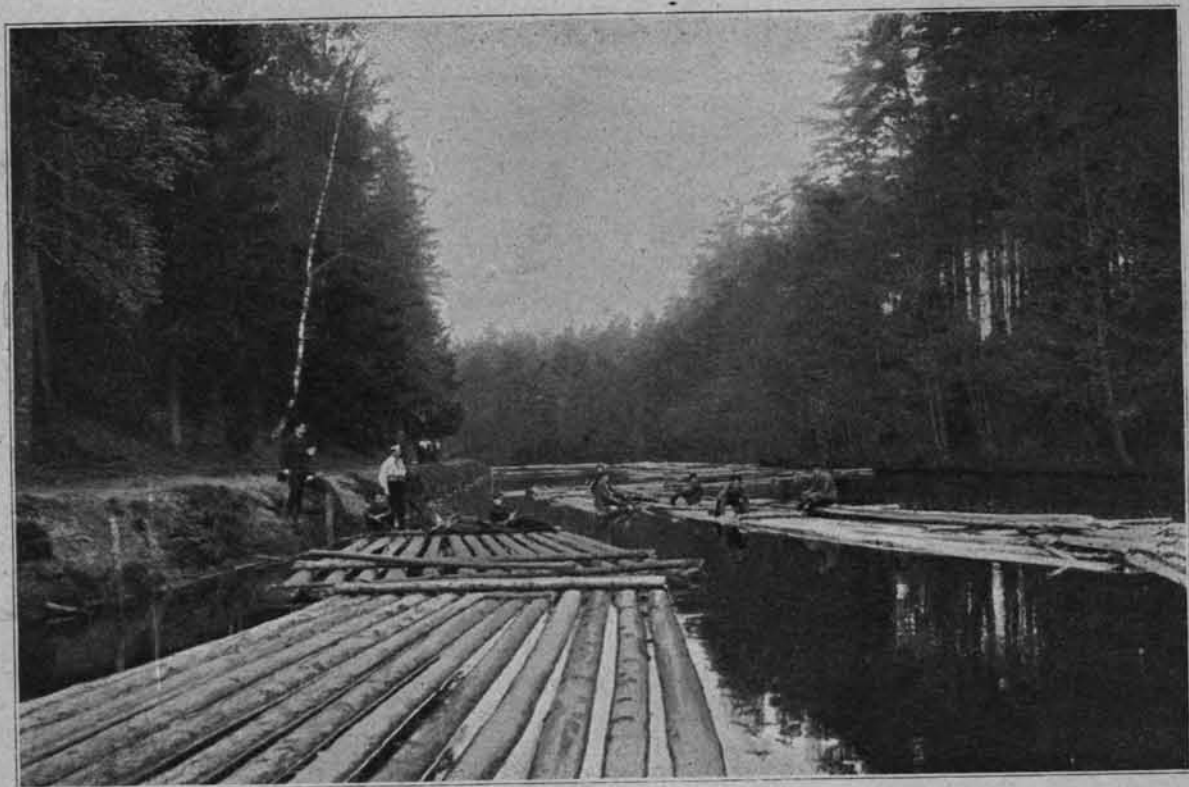
NA KANALE AUGUSTOWSKIM.