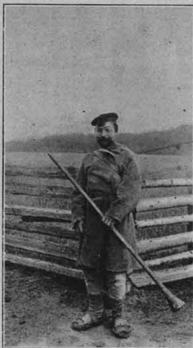
PASTERZ WIEJSKI W AUGUSTOWSKIEM.