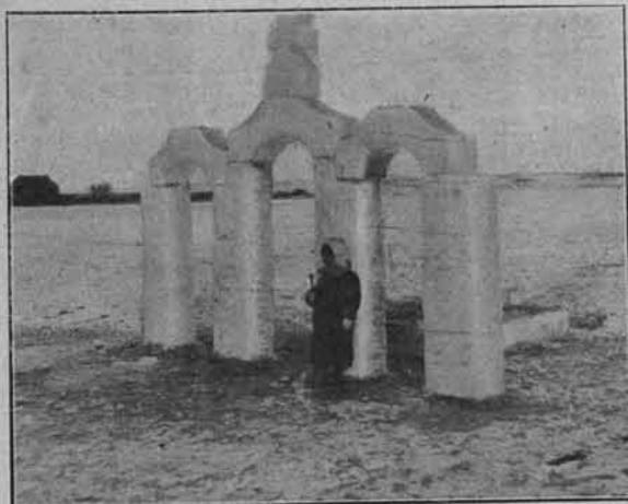
BRAMA Z LODU.