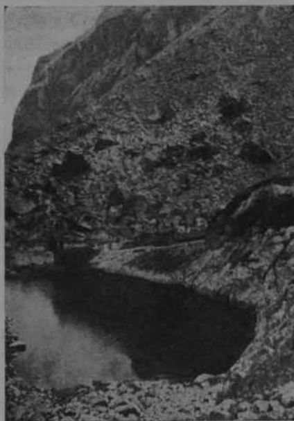
Ryc. 9. Warzęchowy Staw.

Nader ciekawą grupę stanowią stawki w dolinie Staroleśnej. Prawie wszystkie położone na dość znacznej wysokości (1833 m.—2500 m.) na obszernym zrównaniu w górnej części doliny, zamkniętym 200 m. progiem od niższej części doliny, po którym spada wodospadami potok Staroleśniański. Najniżej z nich położony Warzęchowy Staw (Löffelkrautsee) odznacza się niezwykle malowniczym położeniem. Jest on niemal zawieszony nad doliną Staroleśną (ryc. 9), nad nim piętrzą się ogromne ściany i żleby Sławkowskiego Szczytu. Jest to małe jeziorko (pow. 0.2 ha), bardzo płytkie, zawdzięczające swoje powstanie more-