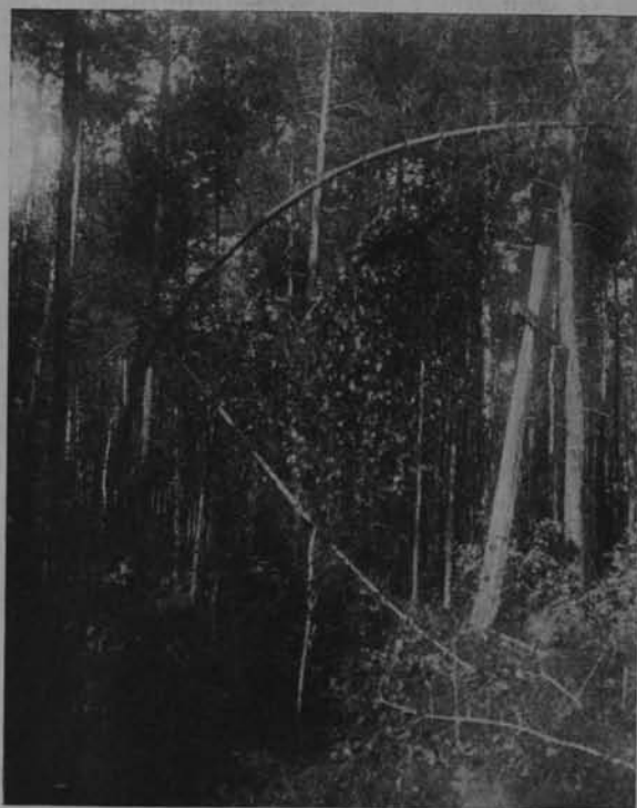
Ryc. 11. Krzyż na mogile powstańca w borze Rowińskim.

A w straży tej poza troskliwością serdeczną, pamięci przyjaciela-powstańca okazywaną, na lasach i bagnach naszych zaciężało jeszcze zadanie zachowania mogi-