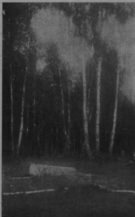
Ryc. 12. Mogiła 5 powstańców z grupy Traugutta w lasach floreckich.

Wtem cicho rozeszła się po lasach wieść w jednym słowie: „Traugutt” zawarta. Snać jednak słowo to znaczną rzecz zwiastowało, bo oto duch potężny wstąpił w partję i wlał w nią wiarę we własne siły. To też, gdy wróg, pewien łatwego zwycięstwa, zaatakował od strony Odryżyna powstańców, doznał na grobli Horeckiej i w lasach przy niej położonych dotkliwej klęski, pozostawiając kilkudziesięciu zabitych i zdobyc w rękach powstańców a bezładnym odwrotem pieczętując zwycięstwo odniesione przez