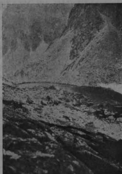
Ryc. 10. Długi Staw.

Z powyższych stawków zbadano Zbójnickie i Staroleśniańskie Stawy (tylko średni i niżny). Stawek Staroleśniański średni, jest to maleńki staweczek (pow. 0.1 ha), bardzo płytki, podczas, gdy średni jest nieco większy (0.2 ha) i głębszy (1.5 m.). Oba jednak przypominają nieco Czerwony Stawek w dolinie Pańszczycy i podobnie jak on wysychają powoli. Zupełnie jednak inaczej przedstawia się sprawa ze Zbójnickimi Stawkami. Są one również niezbyt duże (największy ma ponad 0.3 ha) jednak o dość znacznej głębokości.