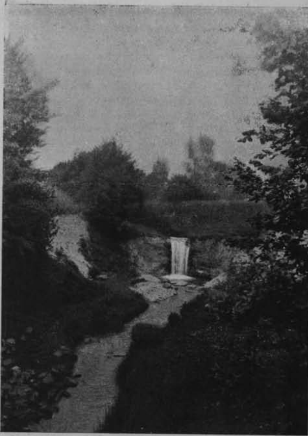
Ryc. 15. Wodospad w dolinie Bętkowskiej. ✓ Fot. ze zbior. Inst. Geogr. U. J. Kl. Ochrony Przyrody.

czaj celowo, niewątpliwie spełni swoje posłannictwo i stanie się lekturą nietylko dla miłośników przyrody, ale również dla nauczycieli oraz kółek przyrodniczych i kółek Ochrony