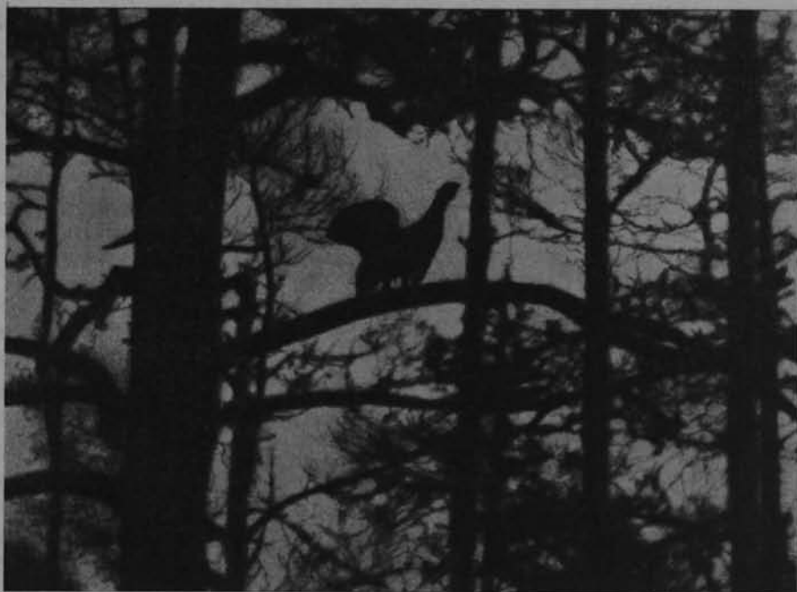
Ryc. 14. Tokujący głuszczyk. Polesie, 1930.

tem w niektórych wypadkach „technik jest poniekąd sprzymierzeńcem ochroniarza i daje mu do dyspozycji środki częściowego przynajmniej chronienia przyrody od ujemnych skutków, jakie pociąga za sobą masowa obecność ludzi”. Po przedstawieniu ogólnych zagadnień Ochrony Przyrody następują rozdziały, w których zagadnienie to jest omawiane praktycznie i szczegółowo. Realizację więc parków narodowych, ich spis na kuli ziemskiej według