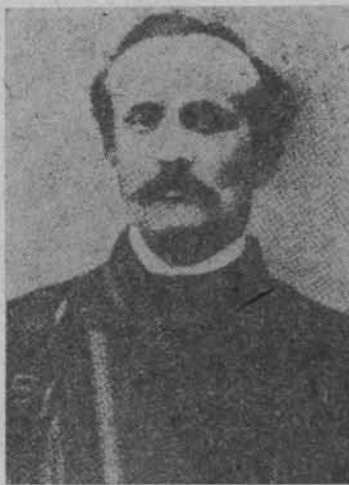
Leon Czarliński — jeden z czołowych działaczy powstańczych na Pomorzu. Reprodukacja z książki A. Bukowskiego Pomorze Gdańskie w Powstaniu Styczniowym