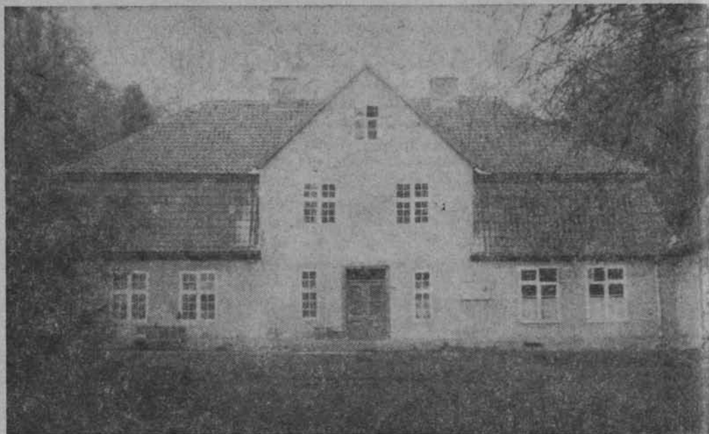
Dworek Donimirskich w Sztumie — Zajezerzu