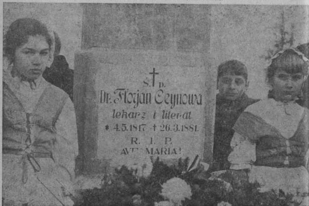
Grób Floriana Ceynowy w Przysiersku. Był on uczestnikiem powstań 1846, 1848 i 1863 r.