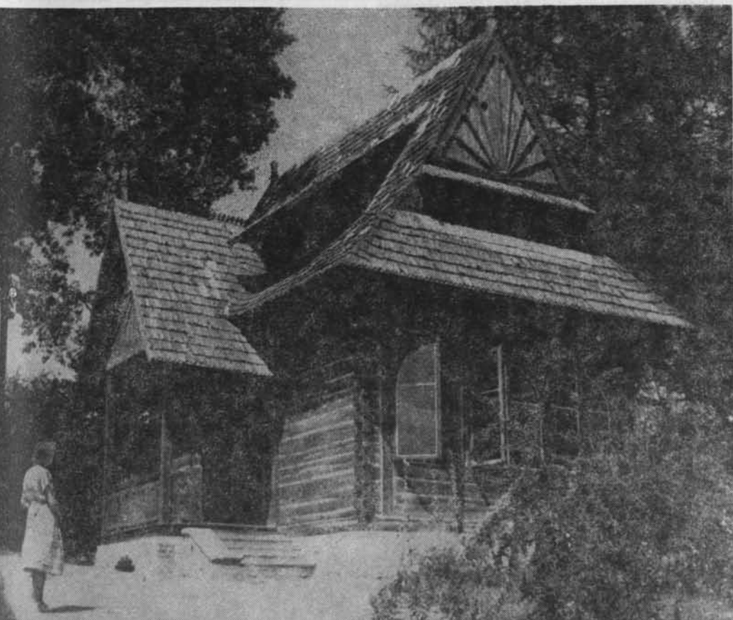
Chata Stefana Żeromskiego. Obecnie Muzeum