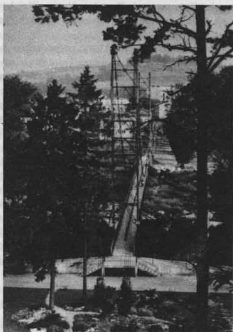
Gorlice — most wiszący na rzece Ropie

do Gródka, wsi leżącej po drugiej stronie pasma Góry Maślanej w Beskidzie Niskim, ciągnącego się od Stróż do Szymbarku. Droga prowadziła na przełaj przez lasy o nazwach: Sośnina, Buczyna, Kopanna, Studzienka, Błędny Las, Ogródki, Grodkowski Las. Tu otwierał się wspaniały widok na górę Chełm i na wieś Gródek, gdzie mój ojciec prowadził kółko rolnicze. W późniejszych latach często odwiedza-