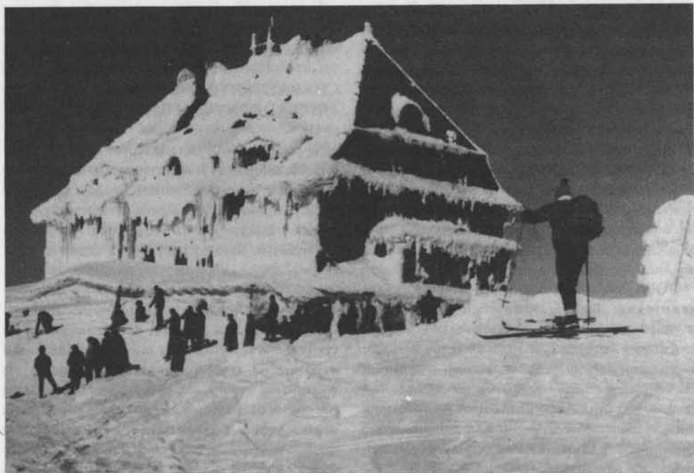
Schronisko PTTK na Szrenicy w Karkonoszach

Na zasadzie nowych inwestycji powstało w 20-leciu, 1951–1970, 39 obiektów z 6275 miejscami noclegowymi. I pod tym względem należy podkreślić olbrzymi wysiłek działaczy PTTK, którzy nie szczędzili zabiegów, by zapewnić przygotowanie dokumentacyjne inwestycji, pozyskać wykonawców i dotrzymać wszystkich terminów realizacji.