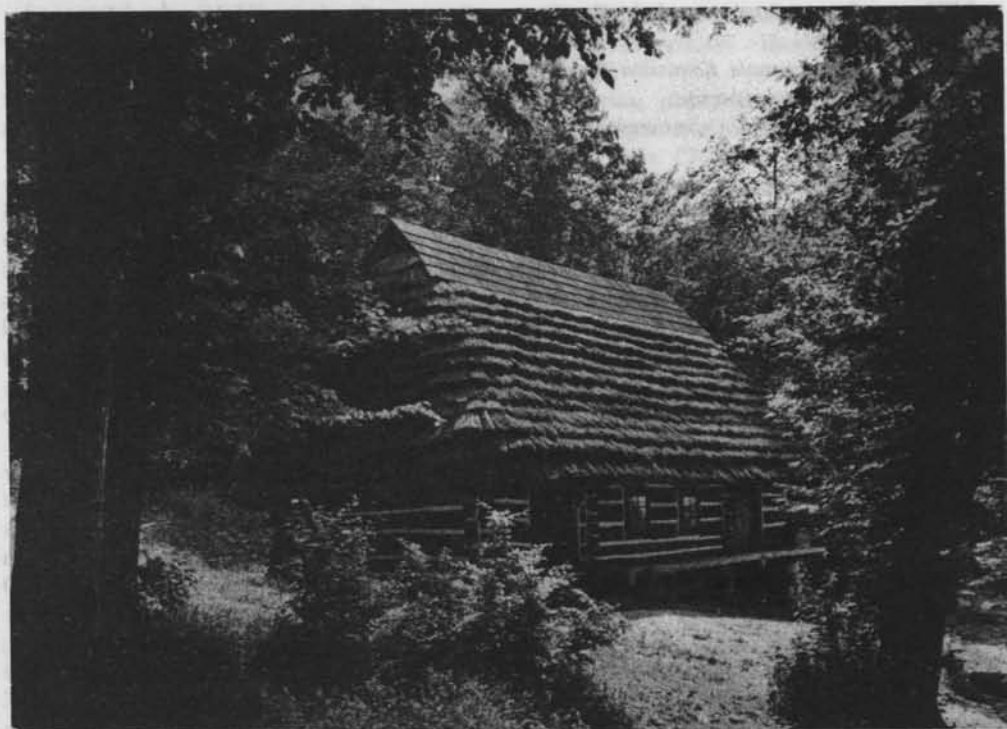
Muzeum Budownictwa Ludowego. Park Etnograficzny w Sanoku – chalupa bojkowska ze Skorodnego

W początkowym okresie Komisja Krajoznawcza skoncentrowała się na upowszechnianiu wśród turystów zasad właściwego zachowania się na wycieczkach, przejawiała wiele troski o odpowiedni wystrój krajoznawczy