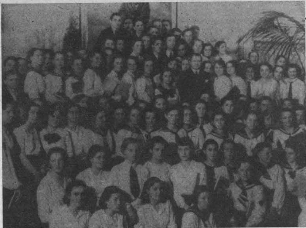
19 czerwca 1936 r. Absolwenci szkół średnich stolicy na Ratuszu w dniu zakończenia roku szkolnego. W górnym rzędzie — prezydent Stefan Starzyński

jak np. Francji, Włoch, Szwajcarii i innych. Na tym tle tym bardziej uwypukla się zły stan pod tym względem w Polsce. Jak wiadomo Polacy są narodem podróżującym, i to coraz liczniej, za granicę, powiększając przez to pasywa bilansu. W związku z tym jedynie drogą zwiększenia pozycji „Przyjazd cudzoziemców do Polski” można będzie zrównoważyć, lub przynajmniej zmniejszyć ujemne saldo bilansu. „Zaktywizowanie tej pozycji jest zagadnieniem o pierwszorzędnym znaczeniu dla gospodarstwa narodowego Polski” 8) . Analiza sytuacji gospodarczej zmusza nas do poszukiwania nowych źródeł dochodu. „Źródłem tym, przy odpowiednim wysiłku całego społeczeństwa i gospodarstwa narodowego Polski, stać się może stopniowo turystyka” 10) .