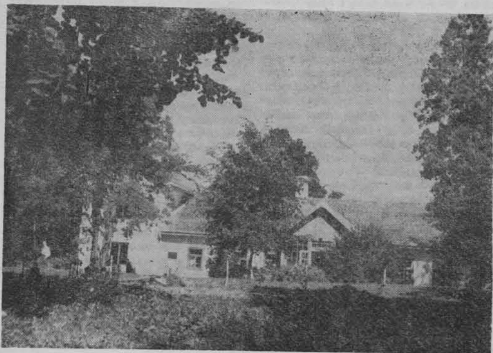
Dom w Żarnowcu — obecnie muzeum pisarki