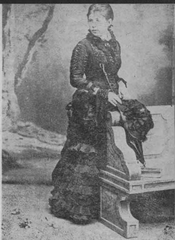
Marja Konopnicka w roku 1879.

Nie przyjechała nigdy więcej do Szczawnicy. Zdarzyło jej się potem zamieszkać w Krakowie, a więc miała okazję odwiedzić wiosną 1890 r. Tatry. Stały się one inspiracją do napisania dwóch wierszy, włączonych potem do cyklu W górach — Noc i Na szczy-