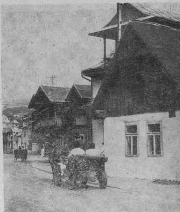
Dom w Szczawnicy, w którym prawdopodobnie mieszkała Konopnicka w 1875 r. ...

W jednym z tatrzańskich wierszy (z 1902 r.) U Pięciu Stawów znajdujemy legendarną i dawną nutę wolnościową, przypominaną przez Konopnicką przez wplecenie do wiersza wątku opowieści o ukrytej w tej dolinie złotej koronie królestwa i uśpionych rycerzach. Realia polityczne w zaborze pruskim i rosyjskim były o wiele trudniejsze do przezwyciężenia niż opór górskich szlaków,