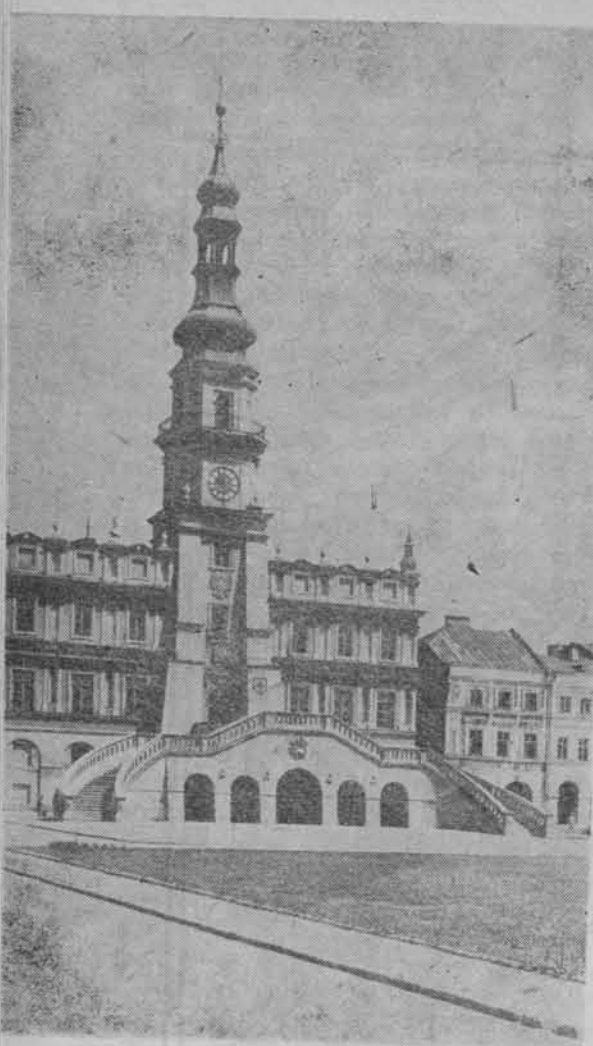
Ratusz w Zamościu, zaprojektowany przez Bernarda Moranda i zbudowany w latach 1591—1622, przebudowany w latach 1639—1651.

cą zabudowę. Większym przedsięwzięciem była rozbudowa dawnych układów przestrzennych; zakładanie nowych dzielnic i wykonywanie fortyfikacji w zmienionych warunkach obronnych.