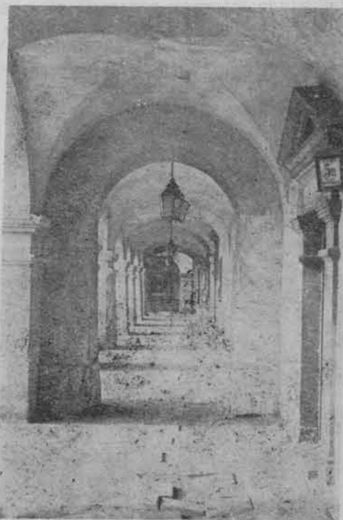
Kamienica „Pod św. Kazimierzem” w Rynku Wielkim w Zamościu.

Jak już powiedzieliśmy nie wyklucza się, że Morando znał Sabbionetę z autopsji. Sława i rozgłos, jakim się cieszyła, dotarły również do przebywającego na studiach prawnych na uniwersytecie w Padwie — Jana Zamoyskiego. Nawią-