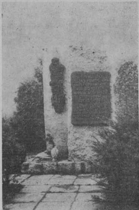
Pomnik żołnierzy Armii Krajowej na rynku w Przasnyszu. Fot. J. Mazowiecki

Pomnik ku czci nieznanego żołnierza poległego w 1918 r. w Rzańniku w Puszczy Białej, woj. ostrołęckie. Fot. J. Mazowiecki