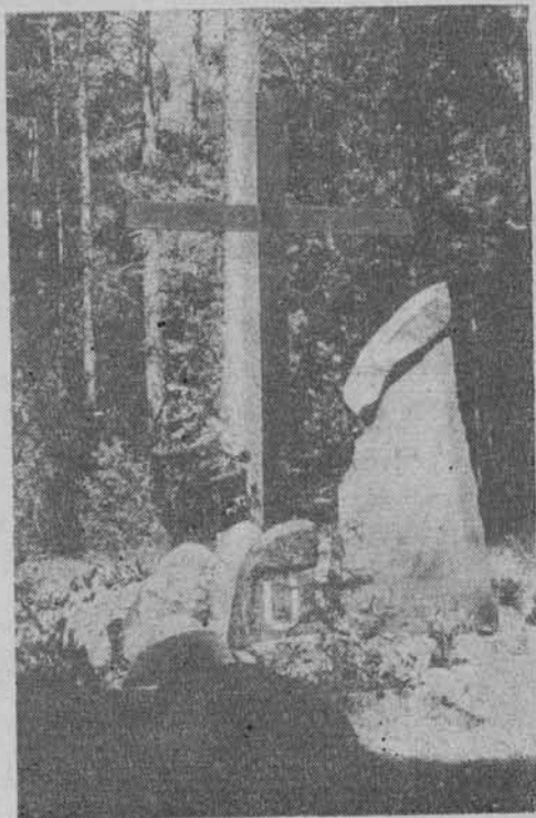
Pomnik żołnierzy AK poległych w 1943 r. w lesie opodal jez. Serwy w woj. suwalskim.

W kręgu turystów zainteresowanych krajoznawstwem z Politechniki Warszawskiej głównym motywem krajoznawczym stała się wiedza o regionie. W przypadku gór, jak już wspomniano, na czoło wysunęły się Bieszczady i Beskid Niski. Oprócz przygotowania kadry przewodników, niezbędne stały się też wydawnictwa, uruchomione w latach sześćdziesiątych w warszawskim środowisku akademickim (łącznie ponad 30 tytułów do 1976 r.). Niektóre spośród nich związane są z okre-