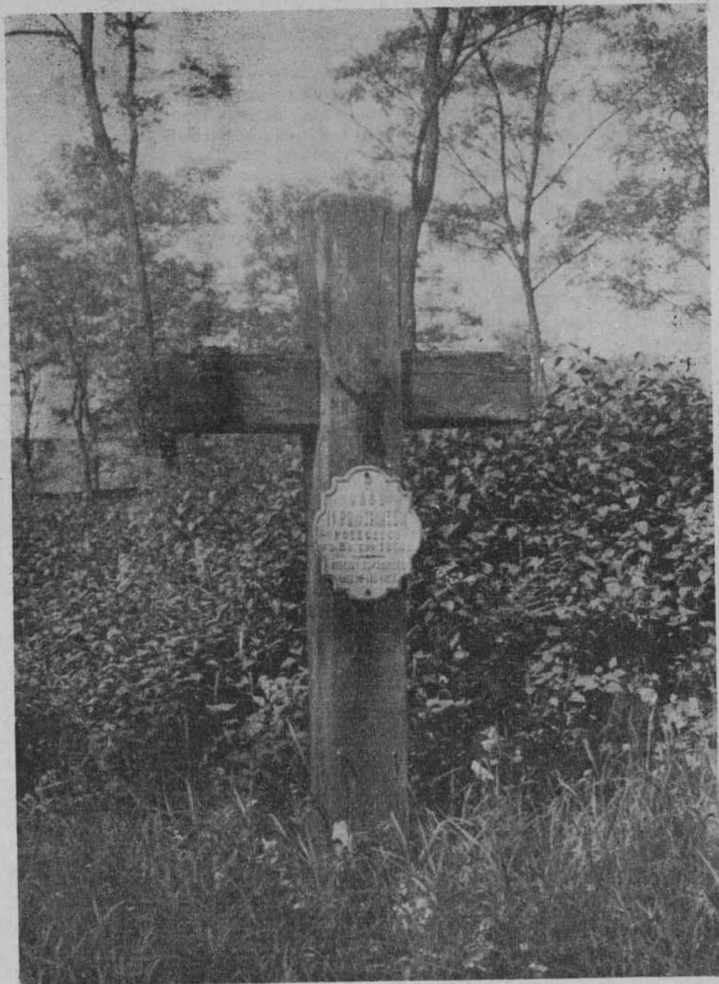
Mogiła powstańców 1863 r. w Prażmowie k. Piaseczna w woj. stołecznym warszawskim.