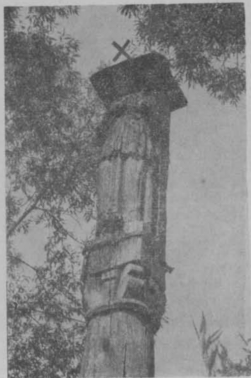
Figura św. Jana Nepomucena prawdopodobnie z XVII w. we wsi Borzuchowo-Dołbogi w woj. ciechanowskim.

Oczywiście, zapoznać młodzież (i nie tylko młodzież) z morzem, to nie znaczy — przywieźć ją na plażę, ale to znaczy po