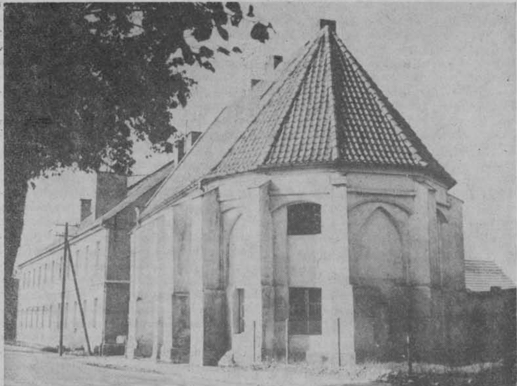
Dawna kaplica św. Jerzego w Trzebiatowie.

Celem i zadaniem krajoznawstwa morskiego jest związanie jak największej liczby ludzi z Bałtykiem. Należy rozbudzić ich zainteresowanie morzem, wykorzystując przede wszystkim coroczny letni exodus nad morze dziesiątków tysięcy wczasowiczów. Niezbędna jest popularyzacja, możliwie najwszechstronniejsza, działania człowieka na morzu, poprzez marynistyczną twórczość artystyczną (literacką, filmową, malarską, fotograficzną), literaturę popularnonaukową, publicystykę, rozwijanie zainteresowań hobbystycznych i popieranie kolekcjonerstwa związanego z morzem, z tradycjami morskimi Polski itp. „Ale nie sposób poprzestać i na tym — kontynuował referent. — Powinniśmy postawić przed sobą zadanie jeszcze bardziej ambitne. Zadaniem tym jest dążenie do umożliwienia każdemu obywatelowi PRL bezpośredniego przeżywania morza na pokładzie polskiego statku albo polskiego jachtu. Następnie przechodzi autor