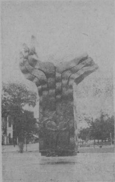
Pomnik przyjaźni polsko-radzieckiej na przyczółku warecko-magnuszewskim (w Magnuszewie).

uwagę na fakt, iż wodoloty wypierają tradycyjne statki żeglugi przybrzeżnej. Jest to dobrze z punktu widzenia szybkości przewozów, z czysto komunikacyjnego punktu widzenia. Natomiast z punktu widzenia krajoznawczego wodolot, pędzący z szybkością samochodu, odbierający turystyce bezpośrednio „morskiej przygody” (wodolot jest zamknięty, nie ma pokładu) — jest nieporównanie gorszym środkiem podróży od tradycyjnego, powolnego statku wypornościowego. A zatem pewną, choćby minimalną liczbę tych statków należałoby utrzymywać na tradycyjnych liniach. Autor postuluje, oprócz wycieczek przybrzeżnych, wykorzystanie białej floty dla dłuższych pobytów wczasowiczów na wybranej trasie, z zawijaniem do wszystkich portów itp. Rzecz prosta, warunkiem rozwoju turystyki morskiej wszelkiego rodzaju, jest zagospodarowanie turystycz-