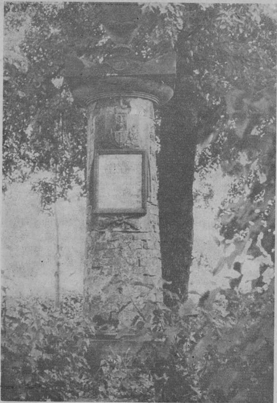
Grobowiec Jakuba Kubickiego, wybitnego architekta epoki Oświecenia w Wilkowie k. Grójca w woj. radomskim.