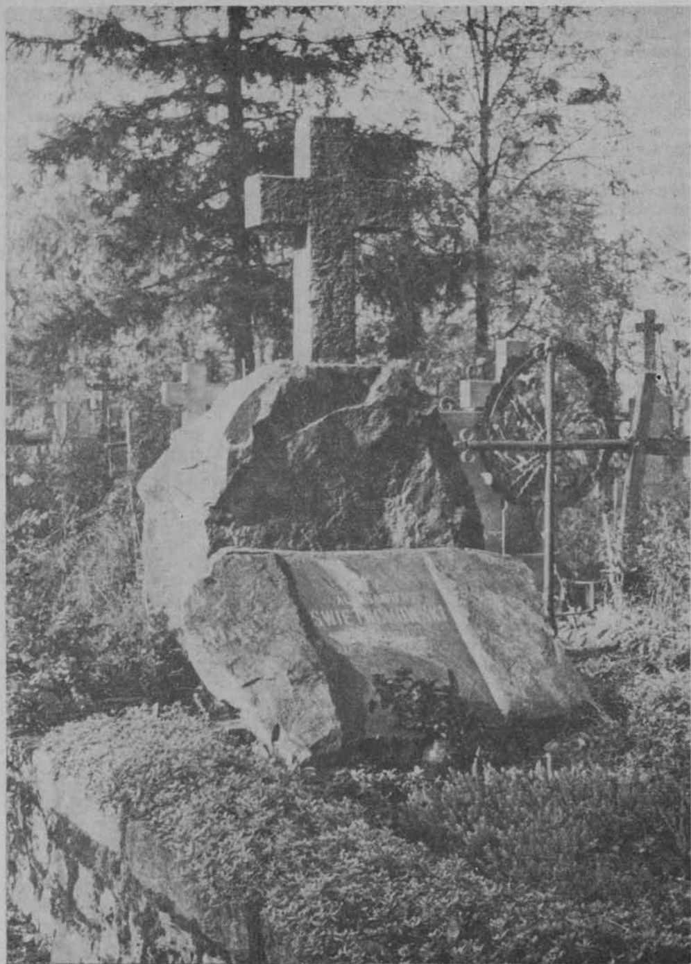
Grób Aleksandra Świętochowskiego w Sońsku k. Ciechanowa.