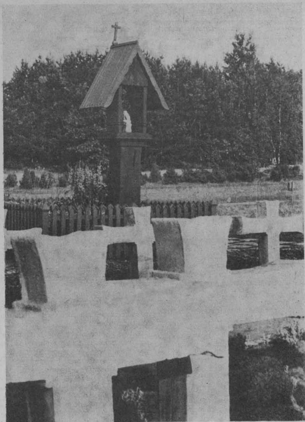
Na cmentarzu pomordowanych przez hitlerowców w Palmirach.