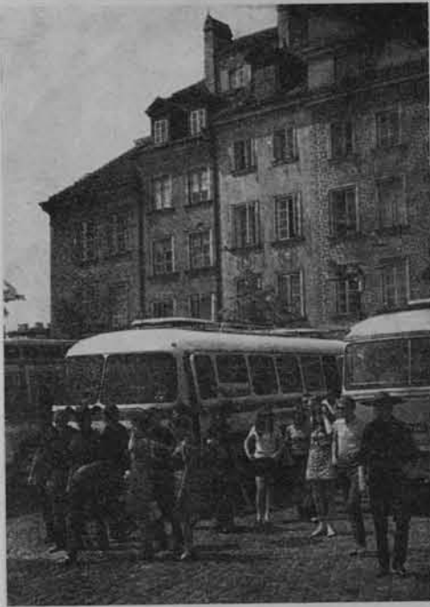
Na placu Zamkowym w Warszawie.

ści, wzajemnej pomocy i życzliwości. I te bezsporne wartości wychowawcze kształtują się w czasie trwania wycieczki.