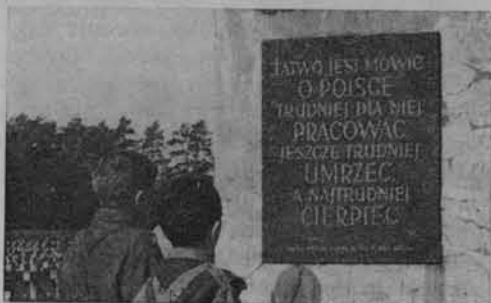
Na cmentarzu w Palmirach.

Z powyższych sformułowań można wnioskować, że do krajoznawstwa zaliczyć wypada to, co dotyczy całokształtu zjawisk występujących na określonych — mniejszych lub większych — obszarach; jest powszechnie akceptowane; nie jest działaniem jednostkowym, a zespołowym