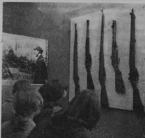
Młodzież poznaje dzieje walk.

Z drugiej strony pozytywistyczne tendencje w polskim krajoznawstwie nie odpowiadają współczesnym warunkom społecznym Polski. Nie wystarczy bowiem przekazywać określoną wiedzę, zalecać