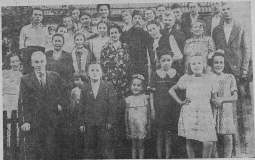
Gorzowianie tatarskiego pochodzenia w czasie obchodów jednego ze świąt muzułmańskich. Zdjęcie pochodzi z początku lat pięćdziesiątych (ze zbiorów Muzeum Okręgowego w Gorzowie Wlkp.)

ludziom młodym, pragnącym zerwać z marazmem w swoim środowisku i dążącym do przywrócenia gminie gorzowskiej dawnej świetności. Wysunęli oni nawet słuszny postulat przeniesienia jej siedziby ze Szczecina na powrót do Gorzowa. Zapowiedzią zmian na lepsze był uroczysty wieczór zorganizowany w dniu 6 grudnia 1980 r. w sali Muzeum Okręgowego w Gorzowie, poświęcony 150 rocznicy Powstania Listopadowego i 55 rocznicy ogłoszenia autokefalii Muzułmańskiego Związku Religijnego w Rzeczypospolitej Polskiej 14) .