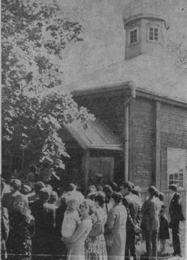
Przed meczetem w Bohonikach tuż po nabożeństwie.

dniach 30 czerwca — 1 lipca tego roku zjechała się na „II Orient Sokólski” duża liczba gości, spośród których wyróżniały się osoby wyznania katolickiego, mające jednak świadomość swego tatarskiego pochodzenia i pragnące odnaleźć ślady swych przodków. Na „II Orient Sokólski” złożyły się: sesja naukowa „Tatarzy w kulturze i historii Polski”, występy Warszawskiego Zespołu Muzyki Orientalnej, wycieczka tatarskim szlakiem połączona z pieczeniem barana i zabawą przy ognisku. Impreza ta, wyłączając sesję, miała charakter festynu ludowego, na którym spotkali się Polacy tatarskiego pochodzenia, muzułmanie i chrześcijanie, a także wszyscy ci, których interesował nieznan