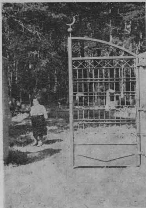
Wejście na cmentarz muzułmański w Bohonikach.

Tatarzy w Białostockiem są od dłuższego czasu przedmiotem zainteresowania nie tylko ze strony turystów, lecz także przedstawicieli różnych dyscyplin nauki, przede wszystkim entografów, orientalistów, historyków i socjologów. Z myślą o nich postanowiono organizować co dwa lata sesje popularnonaukowe przy okazji większych imprez o charakterze ogólnopolskich zjazdów miłośników polskiego orientu. Pierwsza z nich odbyła się w dniach 26—27 czerwca 1976 r. i nosiła nazwę „Orient Sokółski — prawda i legenda”. Inicjatorem tego pomysłu był Ośrodek Kultury w Sokółce, któremu poparcia udzieliły Urząd Wojewódzki w Białymstoku i Białostockie Towarzystwo Naukowe. Zjechało się wówczas do Sokółki ok. 150 osób, wśród których byli naukowcy i studenci z ośrodków akade-