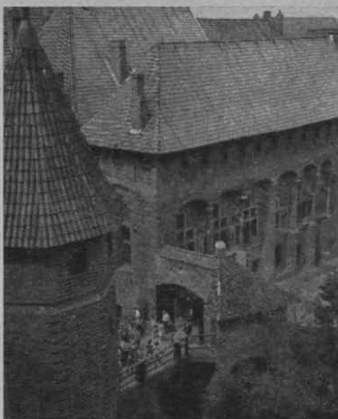
Malbork. Zamek.

odgrywają ruiny zamków oraz średniowieczne fortyfikacje miejskie. Historia dostarcza nam wielu wiadomości o życiu i konfliktach ludzkich z dawnych czasów. Pewną rolę spełniają także przekazywane z pokolenia na pokolenie legendy i mity mające potężny ładunek emocjonalny i romantyczny. Przy wielkim rozwoju techniki i racjonalizmu w naszych czasach przeciętny człowiek ma pewne zapotrzebowanie na szczytę romantyzmu i oderwanie się od prozy codzienności. Jakżeż cenne ze względów kulturalno-psychicznych jest zetknięcie się z ruiną średniowiecznego zamku na skale czy wędrownka po gankach murów obronnych. Wyobraźnia odpowiednio pobudzona informacją przewodnika wypełnia przestrzeń zabytku postaciami z dawnych czasów, kojarzy je z posiadanymi wiadomościami historycznymi, oddziałuje na psychikę zmniejszając zmęczenie i znudzenie. Mamy tu do czynienia ze zjawiskiem terapii emocjonalnej, potrzebnej w naszym wytężonym i dość trudnym życiu wśród miejskiej techniki i nawału pracy. Szczególnie uwydatnia