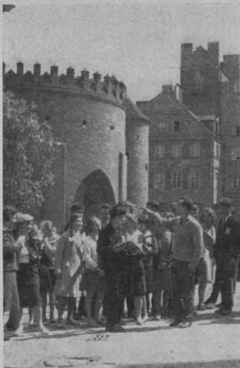
Przewodnik PTTK z wycieczką na Starym Mieście.

Czas i dzieje zachowały nam do chwili obecnej przede wszystkim takie zabytki architektury, które służyły niegdyś specjalnemu przeznaczeniu i spełniały z reguły rolę nadrzędne w stosunku do techniczno-gospodarczej potrzeby tworzenia zwykłych pomieszczeń mieszkaniowo-usługowych. Są to przeważnie dzieła monumentalne. Jednak zachowały się również budowle chłopskie i mieszczańskie mające te same walory reprezentacji kulturalno-społecznej oraz plastycznej. Wszystkie grupy funkcjonalno-społeczne zabytków, a więc zabytki militarne, sakralne, miejskie i wiejskie w odpowiednich przekrojach czasu i na określonych terenach obrazują powstawanie, trwanie i przemiany działalności człowieka,