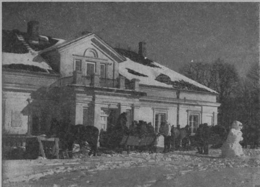
Kampinos. Dom Wycieczkowy PTTK w dawnym dworku.

teli odpowiada ogólnym wytycznym deglomeracji ruchu turystycznego, a więc zasadzie wyprowadzenia turystyki na szlaki dotychczas mało odwiedzane lub wręcz zapomniane pomimo walorów turystycznych, niezbędnych dla właściwego wypoczynku.