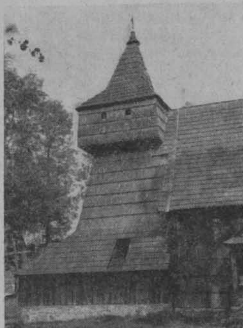
Grywałd. Kościół.

Podobnie jak z zabytkami architektury monumentalnej i miejskiej rzecz się ma z zabytkami wiejskimi, chłopskimi. Jest to jednak problem znacznie trudniejszy, gdyż zabytkowe budowle wiejskie są przeważnie nadal użytkowane zgodnie ze swym początkowym przeznaczeniem. Ponadto jesteśmy świadkami procesu urbanizacji wsi i przekształcania się jej zabudowy. Wyłania się więc konieczność zachowania cennych zabytków tej architektury w dwojaki sposób. Jednym z nich jest organizowanie skansenów tj. muzeów etnograficznych na wolnym powietrzu. Można by przy tym organizować zarówno duże skanseny, jak i małe regionalne, rozsiane w charakterystycznych okolicach i przy szlakach turystycznych oraz w miejscowościach docelowych w ruchu turystycznym. Utworzenie sieci takich skansenów o różnej wielkości jest ściśle związane z polityką rozprzestrzenienia ruchu turystycznego równomiernie po całym kraju.