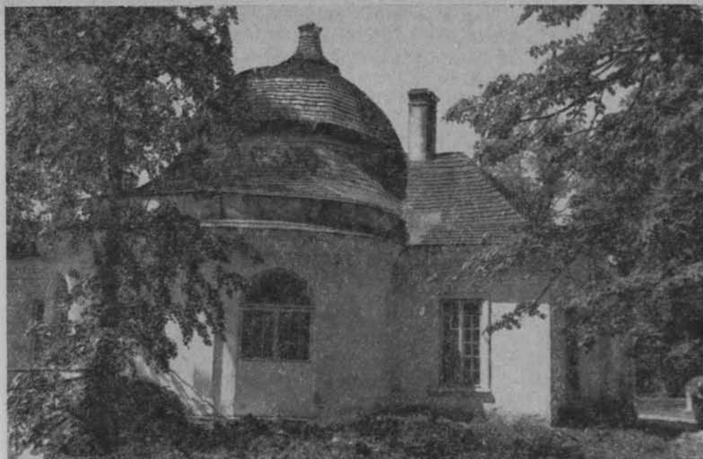
Kurozwęki. Pawilon w ogrodzie.

Przemawiają za tym zarówno względy ekonomiczne turystyki jako czynnika stymulującego w pewnej mierze rozwój gospodarczo-społeczny wielu regionów, jak i względy kulturalno-wychowawcze, zbliżając turystów do wielu mało znanych regionów o bogatej i różnorodnej tradycji kultury ludowej.