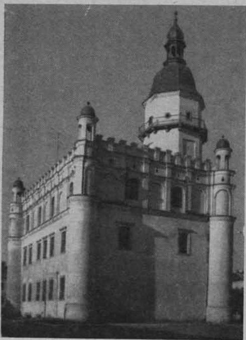
Szydłowiec. Ratusz z XVI w.

Różne są rodzaje i formy ekspozycji zabytków architektury jako obiektów do zwiedzania. Szczególnie cenna i pełna w swym wyrazie i treści jest ekspozycja zabytku architektury wraz z zabytkowym wnętrzem. Obiektem tego typu jest pomnik architektury, a więc dzieło w pełni zachowane w swych pierwotnych o wysokiej wartości artystycznej formach zewnętrznych i wewnętrznych, wzbogacone jeszcze odpowiednim urządzeniem wewnątrz.