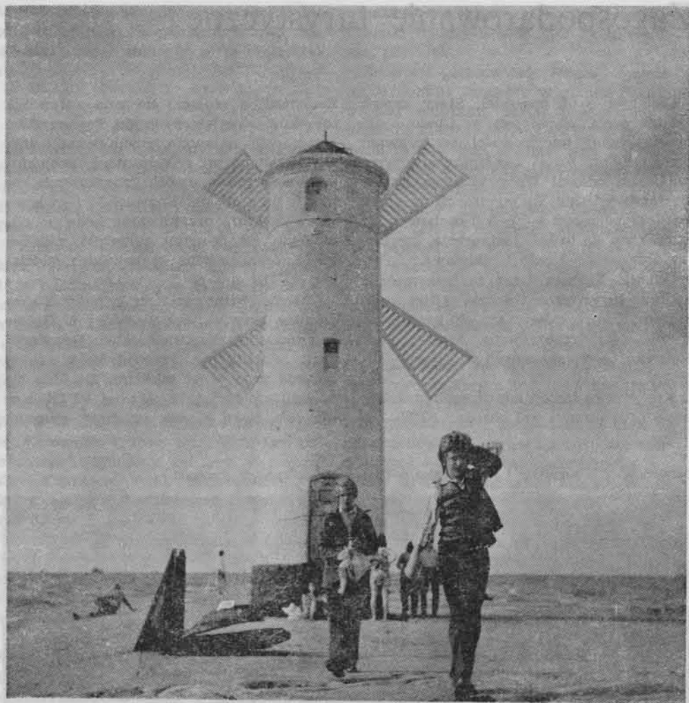
Wybrzeże Bałtyku w Swinoujściu.

i archiwum, klub górski oraz siedziba Komisji Turystyki Górskiej i Narciarskiej ZG PTTK.