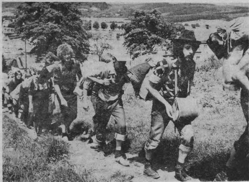
Na szlaku...

od 1978 r. Towarzystwo zrezygnowało z budżetowej dotacji państwowej, chcąc w ten sposób przyspieszyć decyzję o zwolnieniu z płacenia podatku dochodowego i uzyskanie pełniejszej samodzielności. Jednakże spiętrzenie się kłopotów finansowych przy braku decyzji o zwolnieniach podatkowych spowodowało w 1980 r. powrót do dotowania części działalności programowej z budżetu państwa.