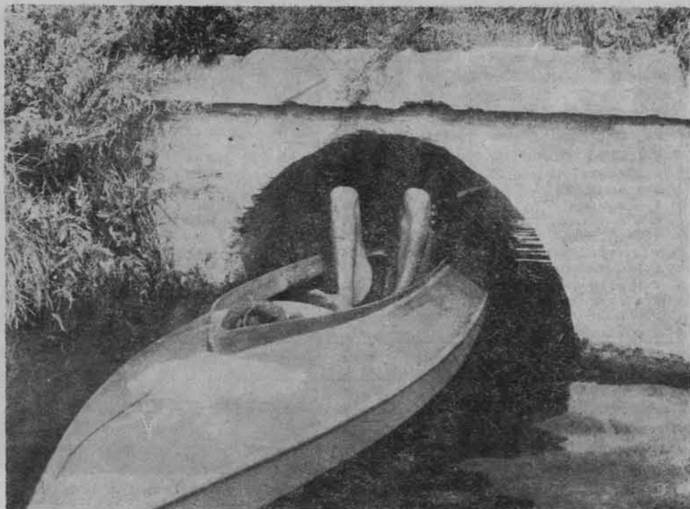
Zdarza się i tak podczas spływu.

nia przy często przepelnionych miejscach wyznaczonych oficjalnie do tego celu, a także niedostatecznej liczbie miejsc w bazie stałej.