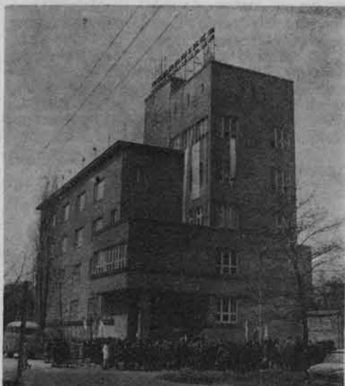
Schronisko PTSM w Krakowie.

Nowe zakopiańskie schronisko mieści się w trzech budynkach byłej szkoły hotelarskiej. Może ono gościć jednorazowo