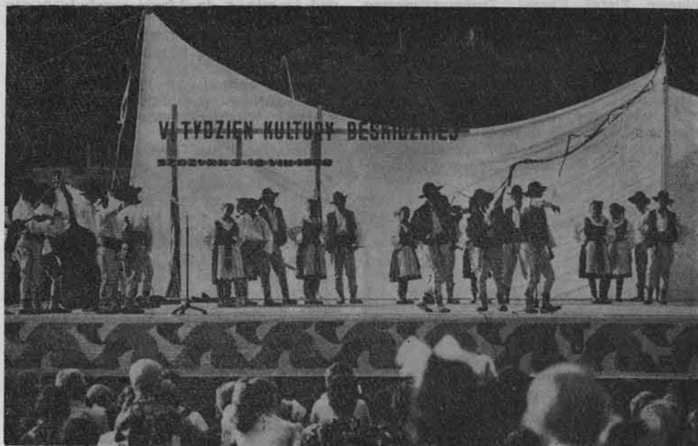
Występ ludowego Zespołu Pieśni i Tańca z Żywca.

Zrzeszenie Studentów Polskich posiada w Szklarskiej Porębie swoją bazę turystyczną. Co rok przyjeżdżają tutaj studenci z wszystkich regionów Polski, by w czasie swego pobytu wyruszyć na turystyczne szlaki.