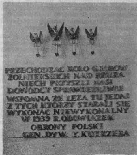
Na ścianie rotundy orły ze sztandarów pułkowych 7, 10, 14 i 56 oraz cytat z przemówienia gen. T. Kutrzeby.

W Muzeum Bitwy nad Bzurą zgromadzono cenne dokumenty obrazujące przebieg tej wielkiej operacji wojskowej, podczas której żołnierze Wojska Polskiego toczyli ciężkie boje z przeważającymi siłami wroga. Znajdują się tu księgi pułkowe, szkice bitewne, wykazy jednostek biorących udział w poszczególnych fazach bitwy, egzemplarze ówczesnej broni różnych formacji, hełmy, części ekwipunku wojskowego znalezione na pobojowiskach oraz urny z ziemią pobraną na cmentarzach wojskowych z 1939 r.