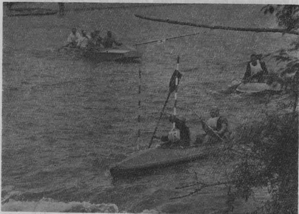
Kajakarze pokonują bramki „Ptasiego uskoku” między Czorsztynem i Krościenkiem.

Niemal dwóch wieków sięgają również badania hydrologiczne. Od XVIII w. bez przerwy prowadzi się badania stanu wód. Wynikło to z konieczności przewidywania groźby wielkich powodzi, które w górskich rejonach województwa krakowskie-