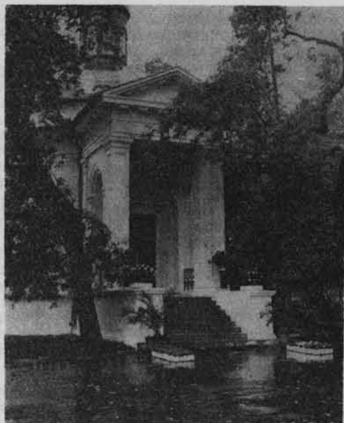
Ogólny widok rotundy znajdującej się w parku im. Wiosny Ludów.