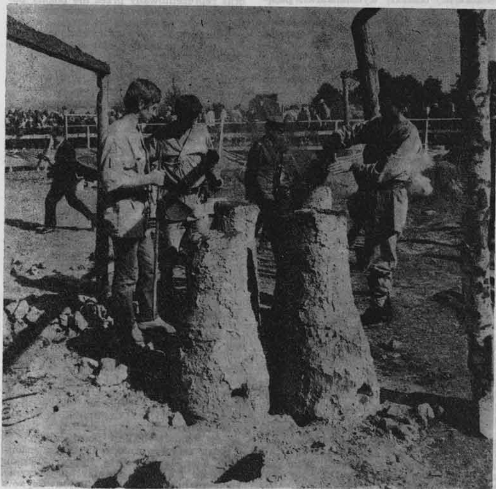
Rudnicy przy wytopie żelaza.

W Słupi Nowej pod Łysicą w dniach od 13 do 16 września 1969 r. dymyły starożytne dymarki. Organizatorem „Dymarek Świętokrzyskich 69”, był specjalnie powołany Turystyczny Komitet Organizacyjny wspólny z redakcją Słowa Ludu .