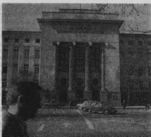
Gmach Akademii Górniczo-Hutniczej w Krakowie.

W Piłe znajduje się Muzeum Stanisława Staszica, gromadzące cenne pamiątki po wybitnym uczonym, ojcu polskiego