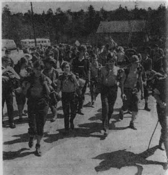
Turyści na trasie rajdu.

W dniu 4.II.1969 r. gwiazdzystym zlotem na Jaworzynie Krynickiej zakończył się Rajd Narciarski Szlakiem Partyzantów. Był on jedną z imprez turystycznych