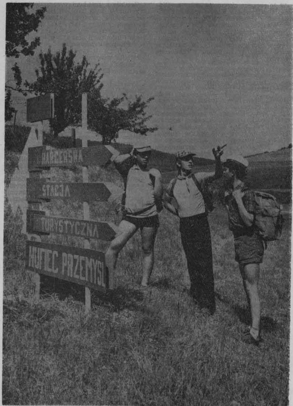
Wycieczka z Warszawy do Karpacza (1927) - grupa z Zakładu Fizjologii i Higieny Uniwersyteckiego Instytutu Fizjologii i Higieny w Warszawie