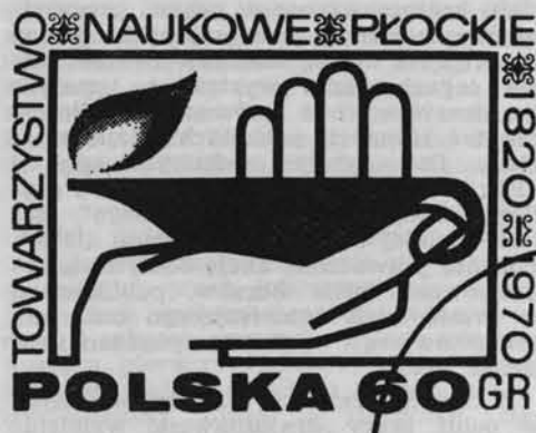
Znaczek pocztowy upamiętniający jubileusz 150-lecia Towarzystwa Naukowego Płockiego.

3 czerwca 1969 r. odbyły się w Płocku uroczystości z okazji 150-lecia Towarzystwa Naukowego Płockiego. Na uroczystą