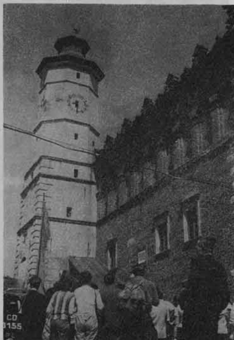
Turyści przed starym ratuszem sandomierskim.

Sandomierz należy do najbardziej ożywionych ośrodków turystyki w województwie kieleckim. Rocznie zwiedza miasto i okolice około 450 tys. osób. Zatrzymuje się w nim co trzeci turysta odwiedzający region świętokrzyski. Zabytki architektury, historia miasta i jego ciekawe podłoże wywołują duże zainteresowanie turystów.