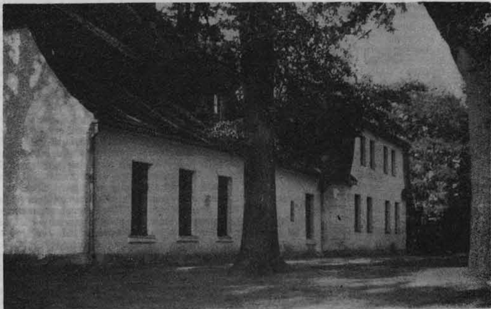
W niewielkim dworku w Będominie (pow. Kościerzyna) mieści się stała ekspozycja poświęcona Józefowi Wybickiemu.

M. in. harcerze Gdańskiej Chorągwi ZHP przepracowali przy tej drodze 8500 roboczogodzin.