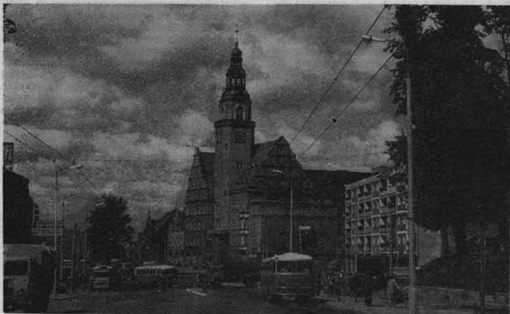
Zabytkowy ratusz z XIX w. na rynku Starego Miasta w Olsztynie.

oraz organizuje samodzielnie wiele wycieczek turystycznych.