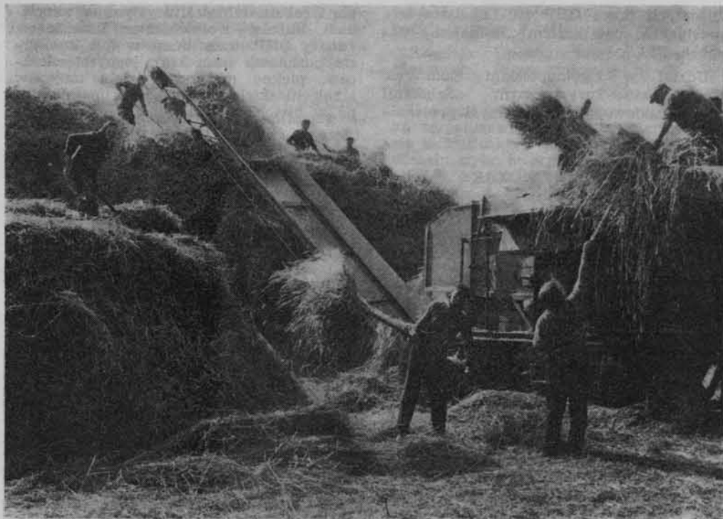
Junacy OHP często pracują przy żniwach.

Porytowe Wzgórze w lasach janowskich. Ponadto zakład pracy zorganizował dla młodzieży OHP wycieczki na wybrzeże do Gdańska, Gdyni i Sopotu oraz do Malborka, co pozwoliło poznać zabytki zwiedzanych miast oraz życie gospodarcze rejonu nadmorskiego (m. in. Żuławy). Szczególnie zainteresowanie młodzieży wzbudziło zwiedzanie Stoczni Gdańskiej i poznanie pracy stoczniovców, bowiem hufiec przy WSK przygotowuje przyszłych ślusarzy, tokarzy i spawaczy. Atrakcyjność wycieczek została wzbogacona o przejażdżkę statkiem.