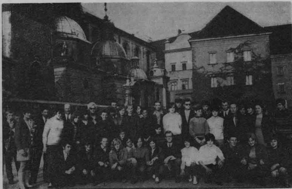
Uczniowie SPR z Wisznic na wycieczce w Krakowie.

raz pierwszy zetknęli się z morzem i poznali osiągnięcia polskiego przemysłu stoczniowego. Młodzież ze Szkoły Przysposobienia Rolniczego w Chełmie Lubelskim pracująca w hufcu przebywającym w województwie szczecińskim zwiedziła Cedynię, miejsce chwały oręża polskiego przed dziesięciu wiekami i Siekierki upamiętnione walką w latach II wojny światowej. Ponadto niektórzy junacy, uczęszczający do szkół rolniczych, zwiedzili nowoczesny kombinat ogrodniczy w Pyrzycach, PGR w Przelewicach k. Pyrzyc oraz ogrody botaniczne w Szczecinie.