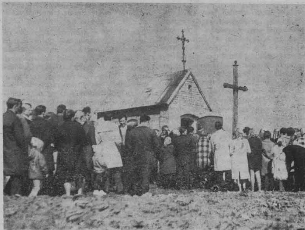
Na Joście po dziś dzień chodzi się tłumnie.

tj. zagłębienia, miały być, według dziśniejszych relacji, śladami „kolanek i łokci Pana Jezusa, który szedł i spoczywał na tym kamieniu”. Zdaniem niektórych mieszkańców Głupianki miało to się zdarzyć „dwa tysiące lat temu”. W innych, zwłaszcza dalej od Głupianki położonych wsiach słyszy się już niekoniecznie wersję o śladach łokci i kolan wędrującego Chrystusa, lecz — że na kamieniu odciśnięte były stopy Matki Boskiej (Wola Sufczyńska, Władzin), że „ktoś tam się miał objawić, święty Jan, czy ktoś” lub że „tam się coś objawiło” (Sufczyn).