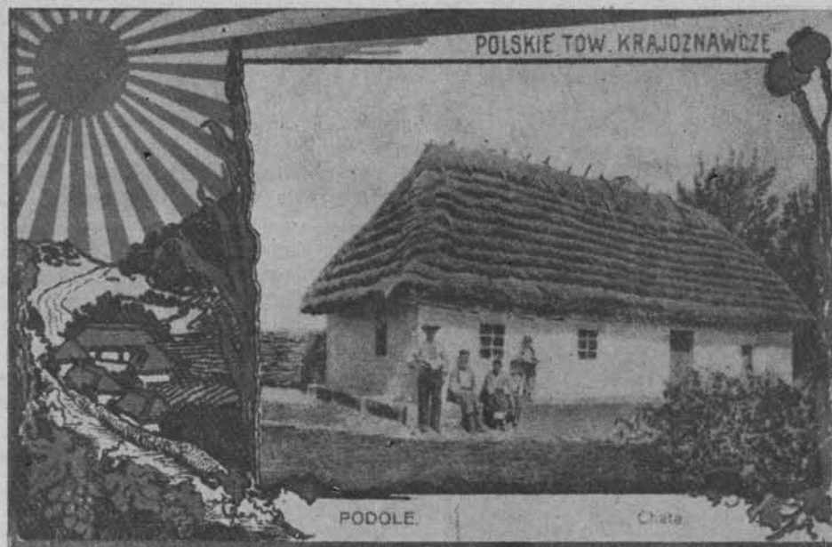
Widokówka z 1908 r.

Widokówka z 1909 r., charakterystyczne przypomnienie rocznicy z dziejów narodowych