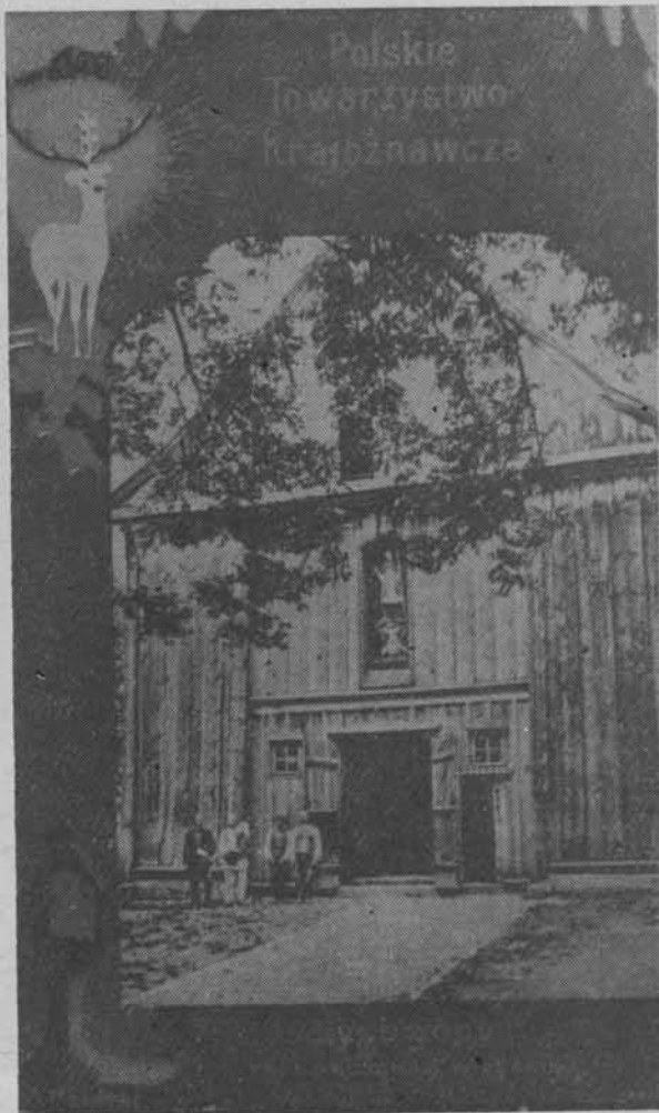
Widokówka z ok. 1910 r.

Główną ilustrację widokówek stanowiły reprodukcje fotografii czarno-białych; umieszczano je czasem na tle zielonym lub kremowym (tinta). Wokół zdjęcia sto-