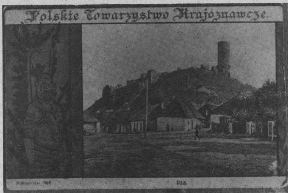
Widokówka z 1908 r., przedstawiająca ruiny zamku w Iłży