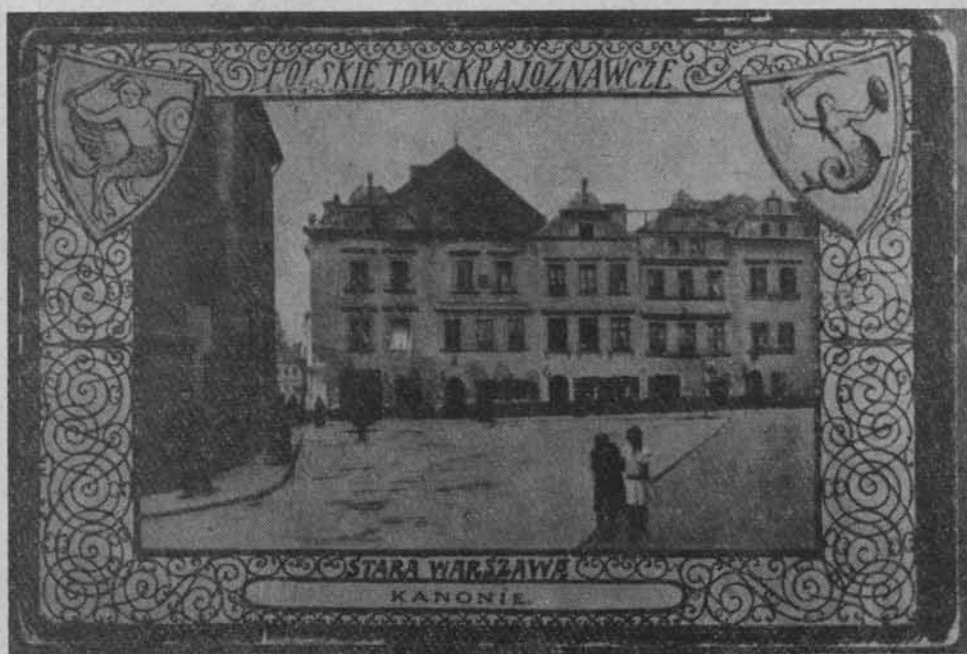
Widokówka. z 1910 r.

Kto był autorem tej pomyslowej i urozmaiconej szaty graficznej?