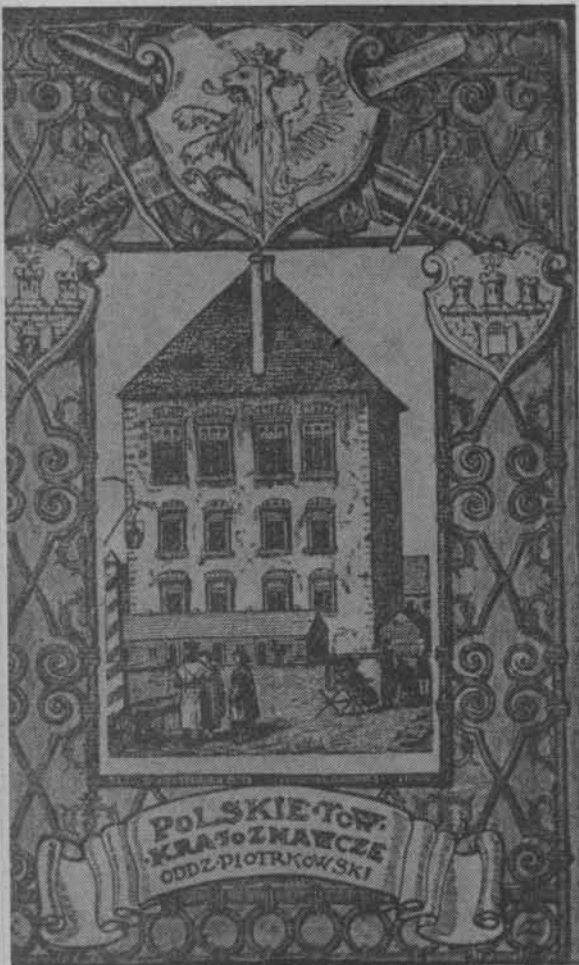
Widokówka z 1910 r.

ro serii o tematyce regionalnej wydały też oddziały terenowe PTK, np. w Krakowie, Piotrkowie, Szamotułach, Warszawie. Ogólnie jednak władze Towarzystwa oceniły działalność wydawniczą do 1938 r. jako słabą. Niewątpliwie zaważyły na tym zarówno przyczyny organizacyjne w samym Towarzystwie, jak i emocjonalne, jeśli idzie o nabywców widokówek — tj. osłabienie istniejących dawniej, podczas zaborów, bodźców patriotycznych. Trzeba też dodać, że w omawianym okresie rozwinęły się na stosunkowo dużą skalę inne wydawnictwa, produkujące pocztówki, jak: „Ruch”, „Książnica Atlas”, „Sztuka”.