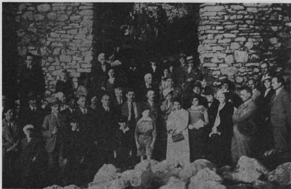
Wycieczka Oddziału PTK na zamku będzińskim w 1934 r.