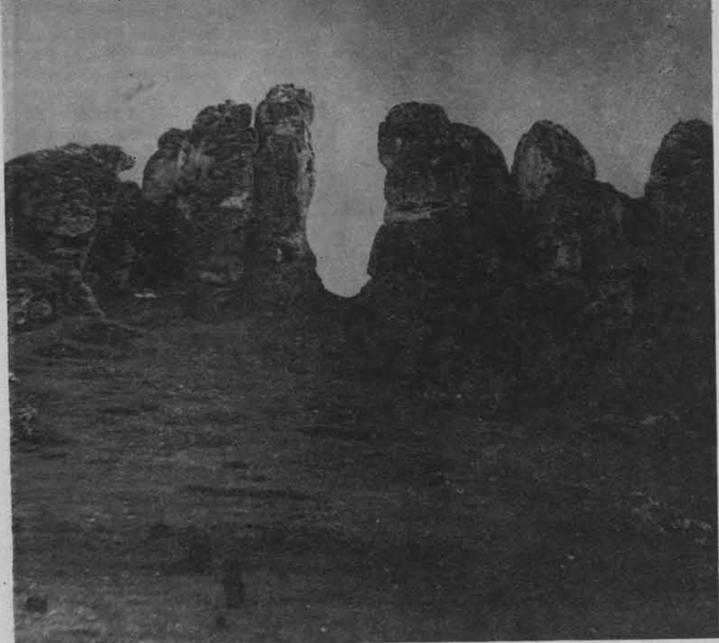
Góry Towarne koło Olsztyna