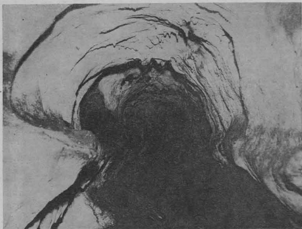
Jaskinia „Dzwonnica” w Górach Towarnych