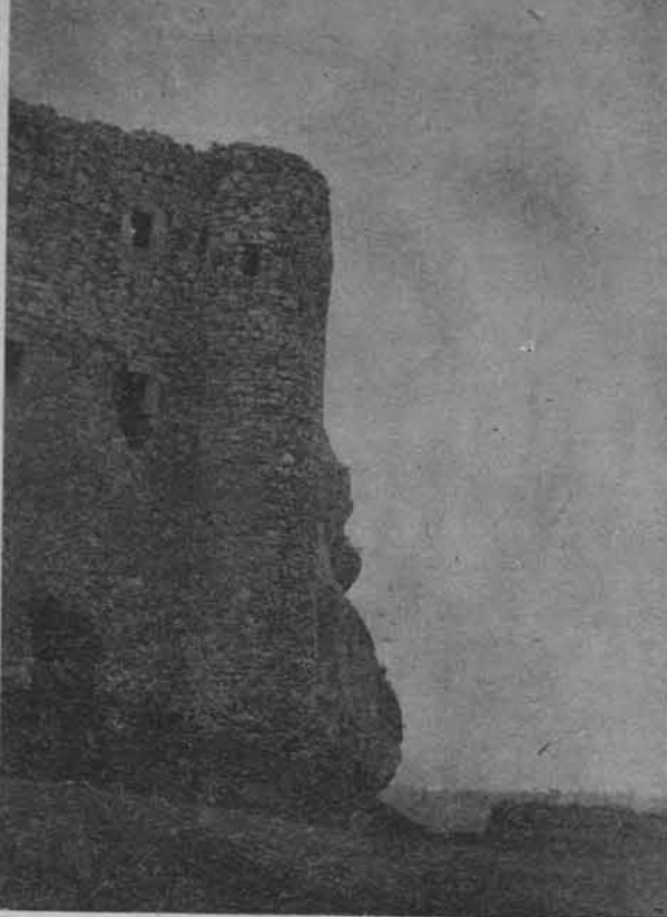
Ruiny zamku w Mirowie (fragment)

tycje, które kolidują z głównymi funkcjami Zespołu Parków. Koncepcja zakłada także powołanie nowych rezerwatów, w tym szeregu rezerwatów krajobrazowych, jako miejsc szczególnie chronionych, oraz stworzenie dużej strefy ochronnej dla Ojcowskiego Parku Narodowego.