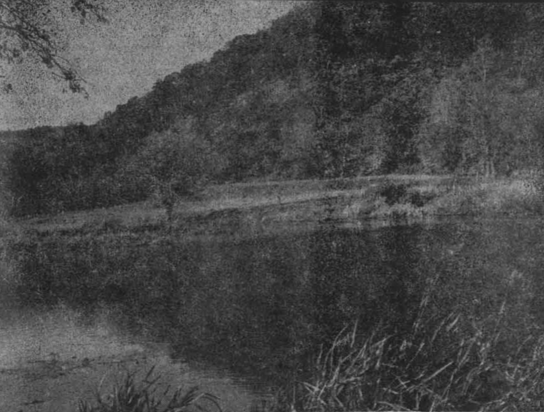
Wzgórze Pachotek w Oliwie. Na pierwszym planie staw, przez który przepływa Potok Oliwski

miennym Potokiem (Sopot) a Kolibkami (Gdynia); do wybuchu II wojny światowej była to rzeka graniczna między Polską i Wolnym Miastem Gdańskiem. 2. Kamienny Potok (3,2 km). 3. Grodowy Potok. Oplywał dawniej osadę grodową w Sopocie, stąd prawdopodobnie jego nazwa. 4. Babiodolski Potok (nazwa od Babiego Dołu). 5. Potok Haffnera (założyciela uzdrowiska Sopot), dawniej nazywany Potokiem Elżbiety. 6. Karlikowski Potok (ludowa nazwa: Karlik). Dawniej nad potokami tymi znajdowało się wiele młynów oraz przepływały one przez liczne stawy. Obecnie niektóre odcinki tych wód zostały skanalizowane.