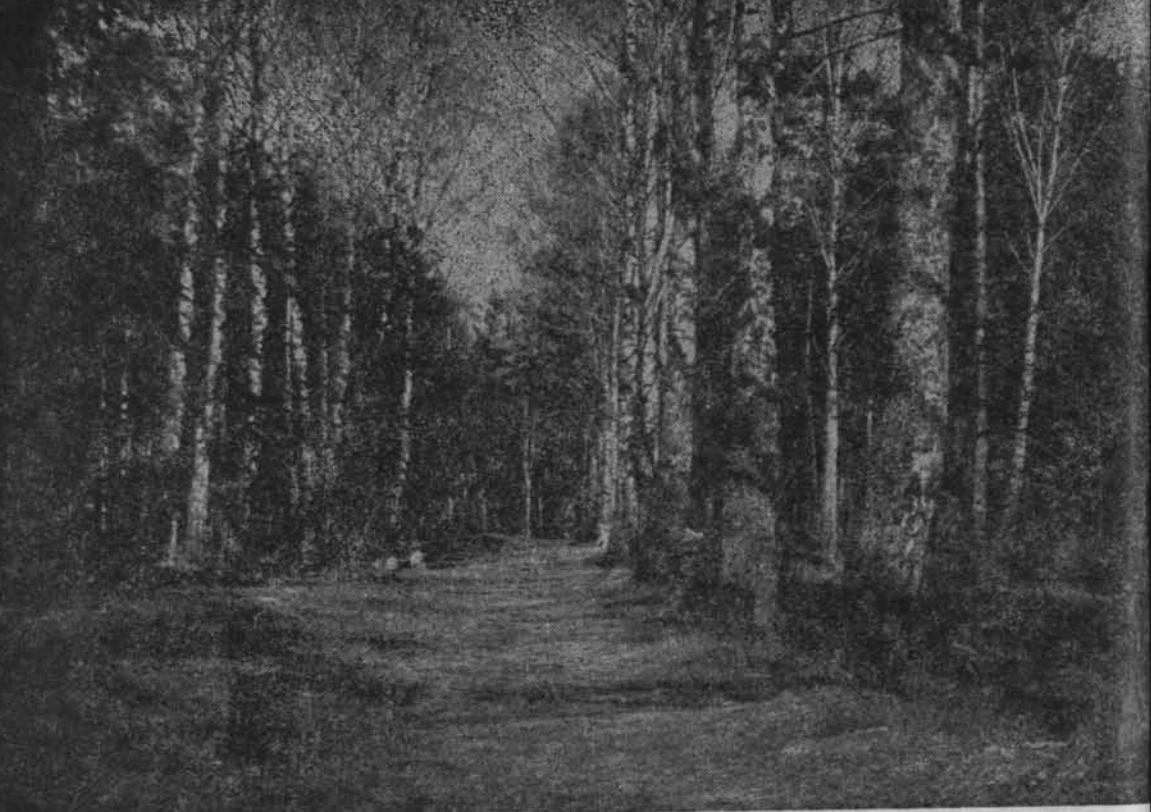
Trójmiejski Park Krajobrazowy — trakt leśny w pobliżu osiedla im. J. Krasickiego w Gdańsku