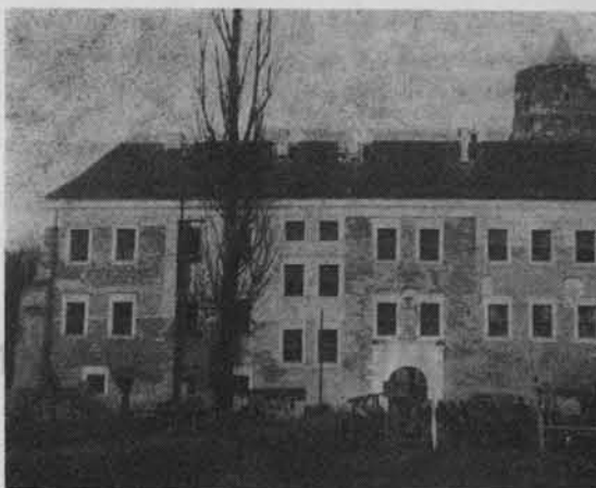
Uniejów. Zamek. Stan robót w 1964 r.

Od początku cieszy się ogromną popularnością i dużą frekwencją. Jest często miejscem zjazdów i konferen-