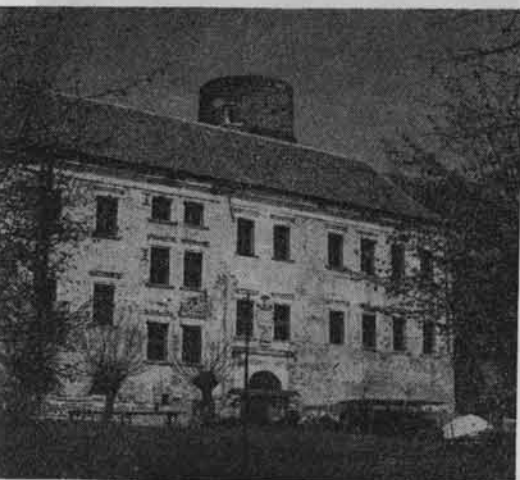
Stan robót w 1959 r.

Założony na planie czworoboku z prostokątnym dziedzińcem pośrodku, zbudowany jest z cegły gotyckiej o układzie polskim z dekoracją o motywach geometrycznych z cegły glazurowanej, odsłoniętej spod tynków w czasie ostatniej restauracji. Jedynie fundamenty zbudowane są z kamienia polnego.