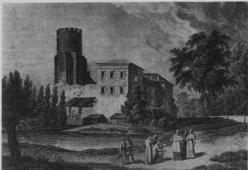
Uniejów. Zamek wg ryciny z 1842 r.

W okresie międzywojennym dobra uniejowskie zostają rewindykowane z rąk dotychczasowych właścicieli i przechodzą na rzecz skarbu państwa. Zamek był już jednak zdewastowany i wymagał znacznych nakładów, na co jednak nie pozwalała ówczesna sytuacja finansowa państwa. Okres okupacji i pierwsze lata po wyzwoleniu przyniosły dalszą dewastację budynku, zwłaszcza w latach 1948—55, kiedy zamek służył jako magazyn zbożowy i naczepów sztucznych miejscowej Gminnej Spółdzielni „Samopomoc Chłopska”.