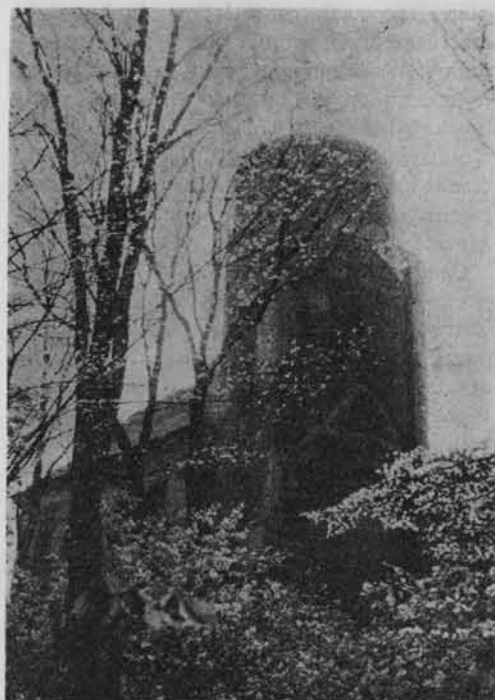
Widok na wieżę od strony parku.