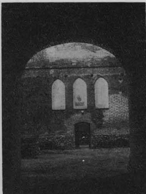
Widok na dziedzińiec od strony sieni wjazdowej.

Odbudowa i adaptacja zamku przeprowadzona w latach 1956—66 objęła następujące prace: