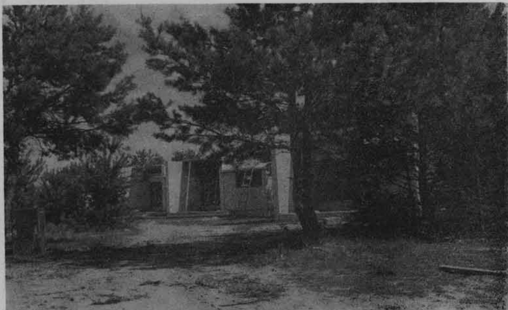
Budowa ośrodka wypoczynkowego nad jeziorem Zagłębcze.

rystyki. Z uwagi na bliskie położenie Lublina, Chełma i Świdnika, wymaga on jednak rozbudowy bazy noclegowej, żywniowej oraz usprawnienia komunikacyjnego.