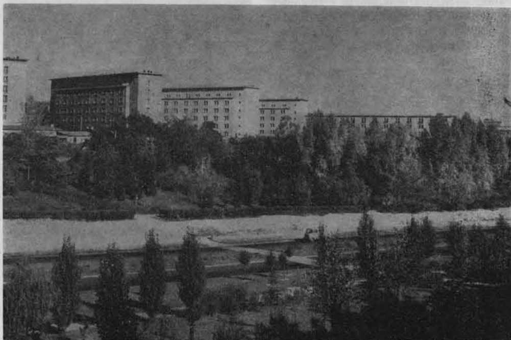
Lublin — osiedle studenckie.

jeszcze linia frontu. UMCS był bezpośrednim wcieleniem w życie hasła Manifestu Lipcowego, zapowiadających natychmiastowe podjęcie odbudowy szkół i bezpłatne nauczanie na wszystkich uczelniach. Organizatorem pierwszej państwowej wyższej uczelni w Polsce Ludowej i pierwszym rektorem Uniwersytetu był prof. dr Henryk Raabe.