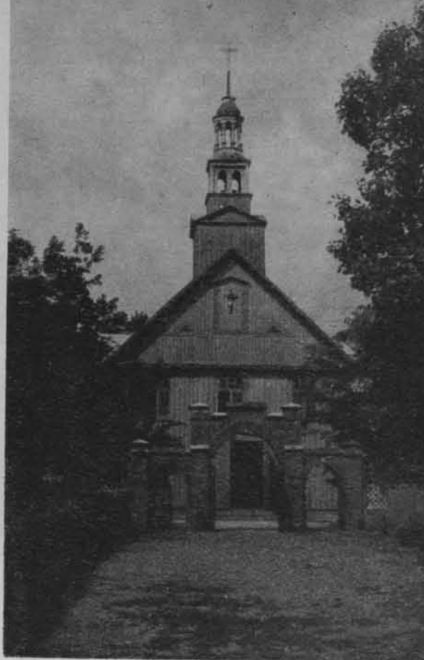
Kościół w Lubielu Nowym

Lubiel — położony na północno-zachodniej rubieży powiatu kamienieckiego, na pograniczu ziemi nurskiej i różańskiej*) — był ośrodkiem szlacheckich dóbr ziemskich ciągnących się na prawym i lewym brzegu Narwi. W połowie XVIII w. dobra lubielskie obejmowały 21 wsi, w tym 6 folwarcznych. Na lewym brzegu były położone: Lubiel, Aleksandrowo, Budy Popielarskie (później Grodziczne), Grądy Polewne, Grądy Szlacheckie (folwark), Grądy Zalewne, Janowo, Julianka, Nowa-