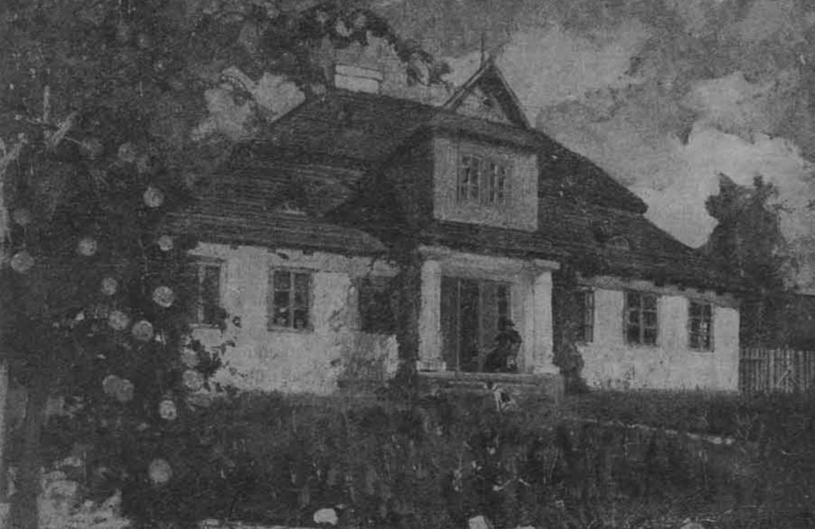
Plebania w Lubielu Nowym. Obraz olejny Henryka Szczyglińskiego (ok. 1930)